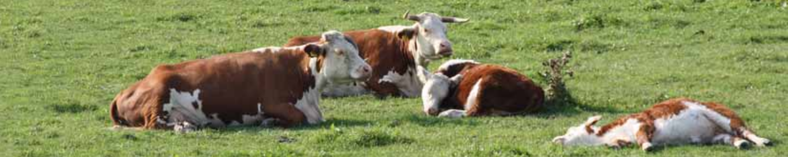
Betesdjuren är en förutsättning för den biologiska mångfalden, ekosystemtjänster och landsbygdsutveckling.

hittills skett i djurens och växternas avkastningspotential och andra viktiga egenskaper. Dessa förändringar har varit helt avgörande för vår livsmedelsproduktion och kommer att bli ännu viktigare i det globala sammanhanget, där vi enligt FAO kan förvänta oss ett behov av fördubblad produktion fram till 2050. De domesticerade arternas mångfald är av största vikt för framtiden och den stora utmaningen ligger i en fortsatt produktivitetsoökning med de arter och raser vi har.