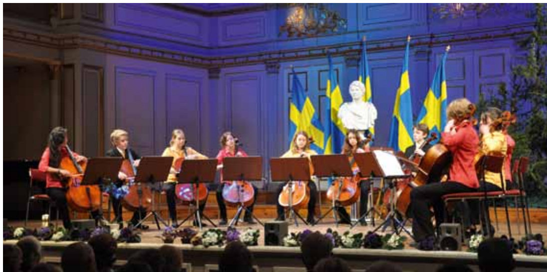
En av de tre duktiga ensembler från Lilla Akademien som underhöll under högtidssammankomsten.