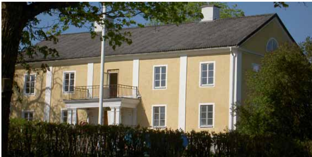
Barksätters egendom utanför Katrineholm.