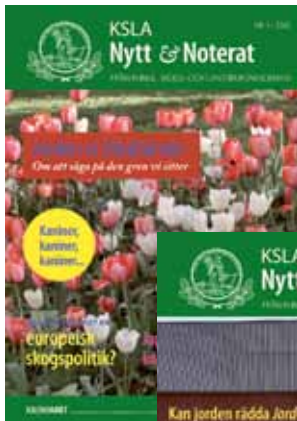
KSLA Nytt & Noterat