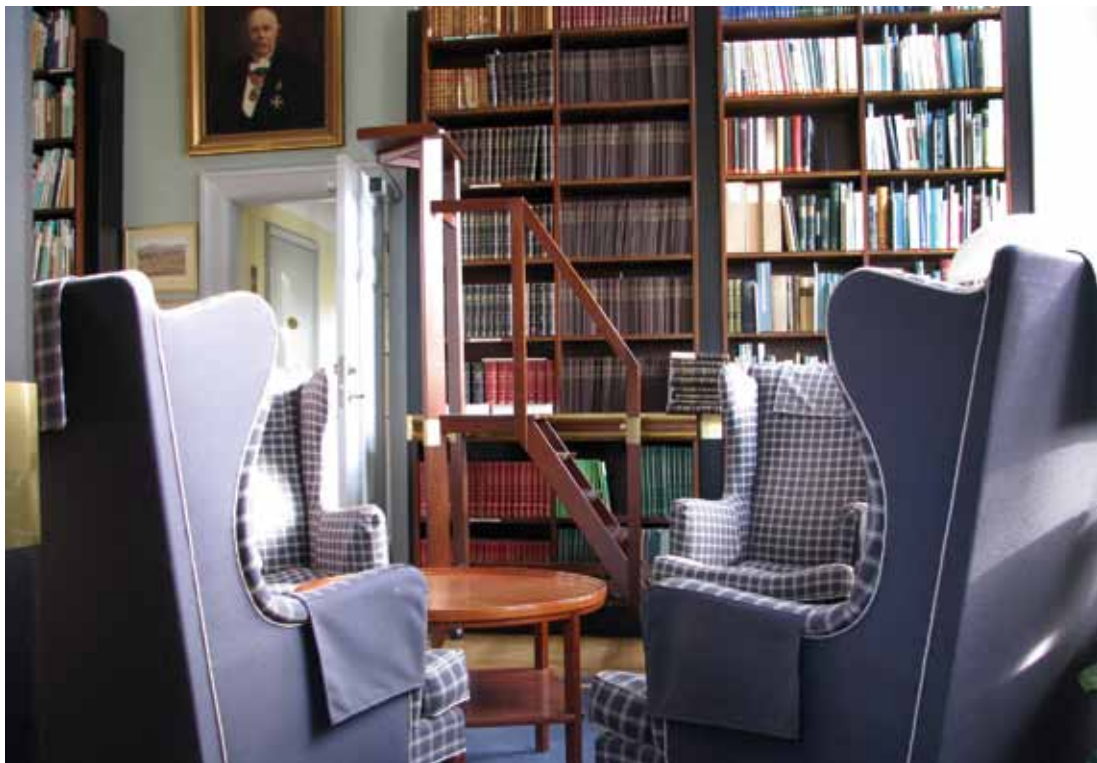
I biblioteket finns alla möjligheter att studera agrarhistoria i lugn och ro.