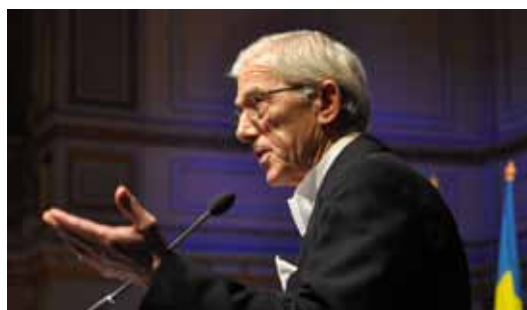
Författaren Theodor Kallifatides höll högtidstalet "Skogens viskningar och rop".