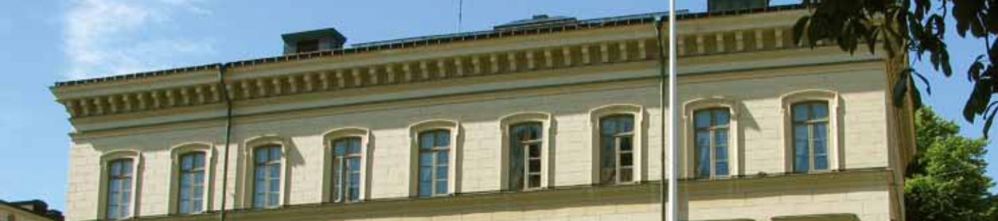
Akademiens kansli håller till högst upp i huset på Drottninggatan 95 B i Stockholm, sommar...