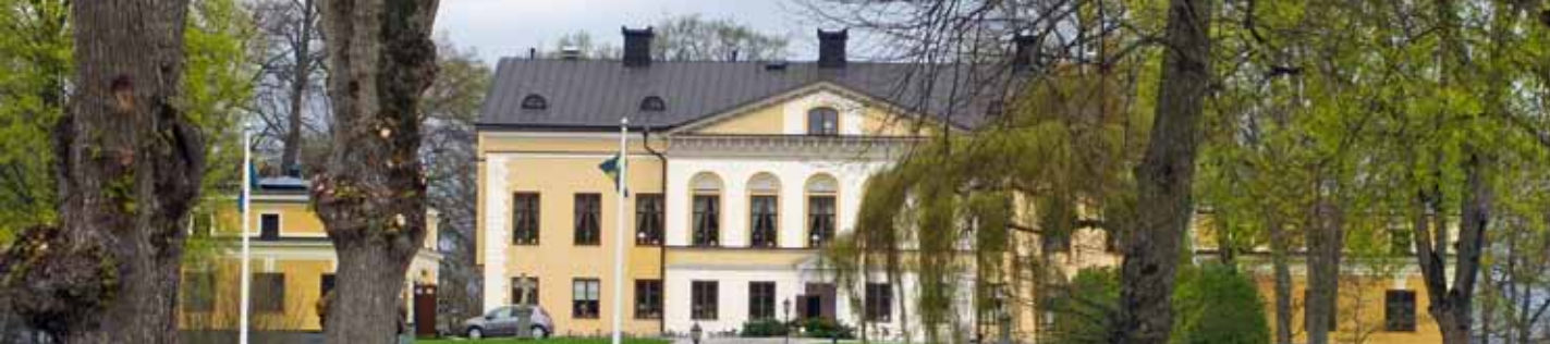
Vårexkursionen gick till anrika Taxinge Gods.

Europa: ”Då blir den svenska Friggeboden av trä en försäljningssuccé”.