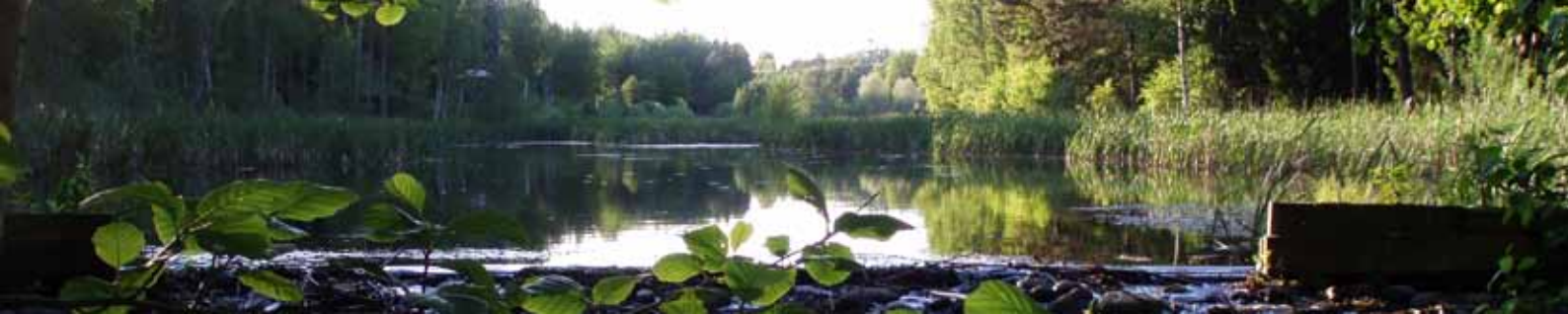
Många risker förknippade med klimatförändringen har med vatten att göra.