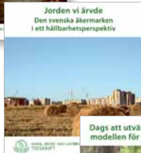
KSLAT – Kungl. Skogs- och Lantbruksakademiens Tidskrift