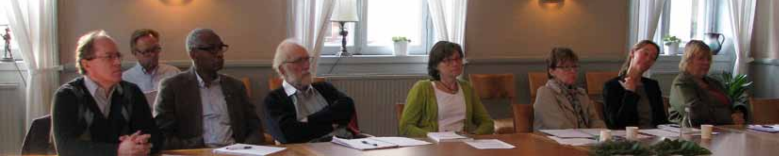
Kommittéerna anordnar regelbundet rundabordssamtal om angelägna frågor.