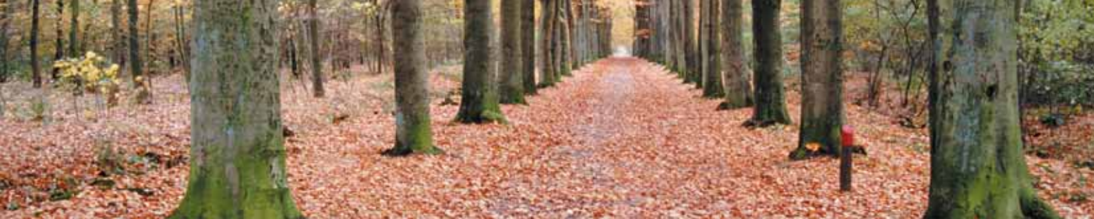
Allén är en intressant företeelse i ett historiskt, kulturellt och biologiskt perspektiv.