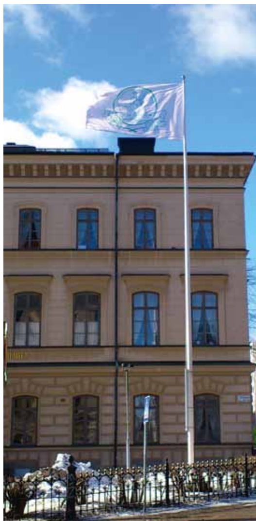
... som vinter.