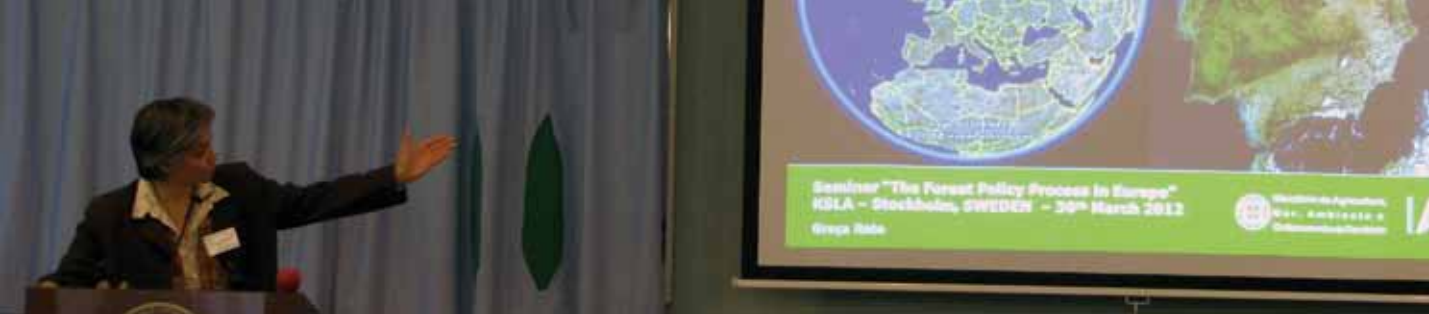
Konferenser och seminarier är en central del i den dagliga verksamheten.