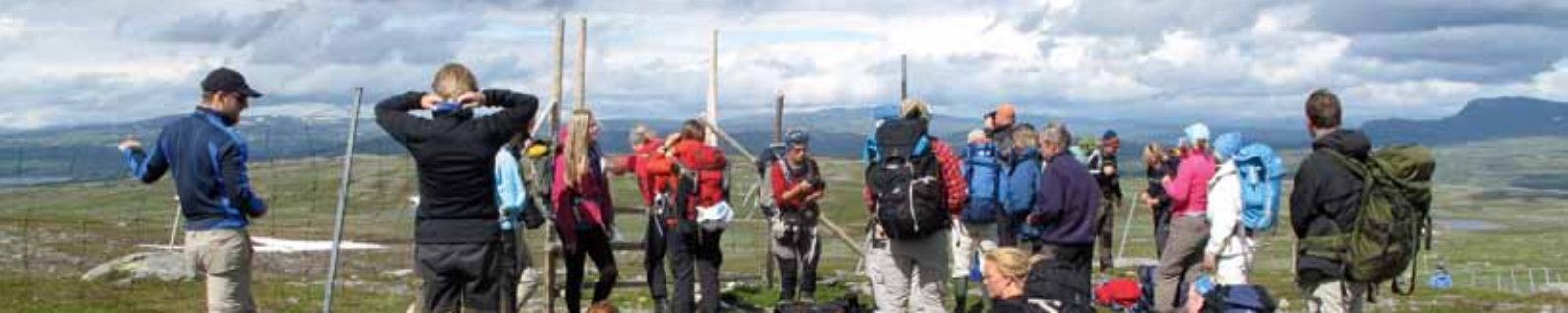
Enaforsholmskursen lockade ett rekordstort antal deltagare som fick några dagar härlig fjällvistelse.

bete med såväl grund- som tillämpad forskning och vi besökte även deras långliggande odlingssystemförsök som pågått sedan 1843. 14 deltagare (J)