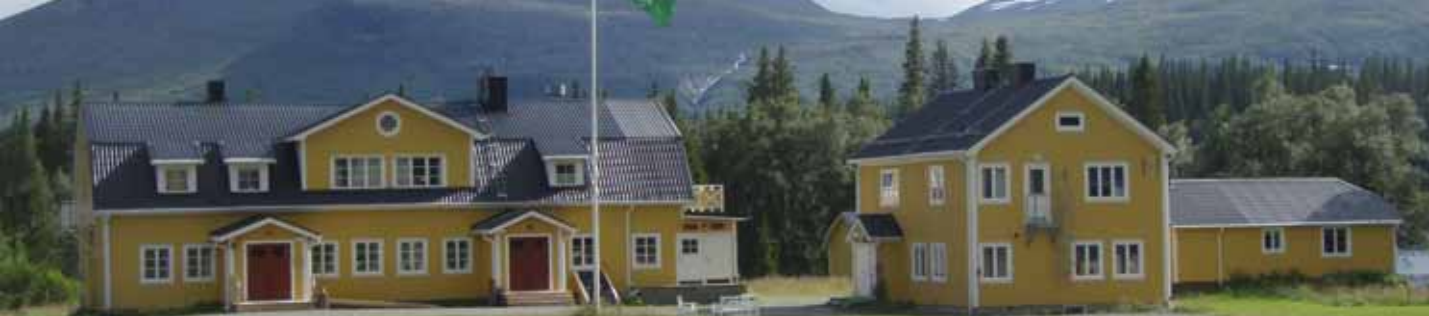
Fjällgården Enaforsholm i Jämtland.