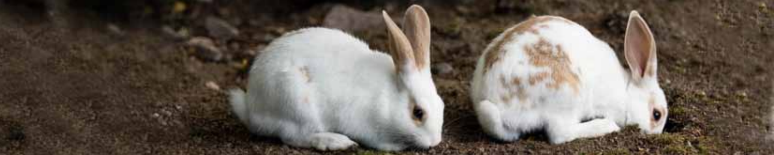
Kaninen – en ekologisk, klimatsmart köttproducent.

som den i stor utsträckning regleras av en nära sekelgammal lagstiftning. Huvudsyftet med denna workshop var att sammanföra ekologer och jurister med ett gemensamt intresse för vattenkraftsfrågor. De medverkande var särskilt inbjudna och representerade universitet, myndigheter och naturvårdsorganisationer. Olika miljöeffekter av vattenkraft presenterades och diskuterades liksom hur ärenden rörande nybyggnad, omprövning och tillsyn av vattenkraftsverksamhet bedöms och hanteras. Presentationerna av miljöeffekterna gav en bred översikt av vattenkraftens konsekvenser för biologisk mångfald och olika ekosystemprocesser.