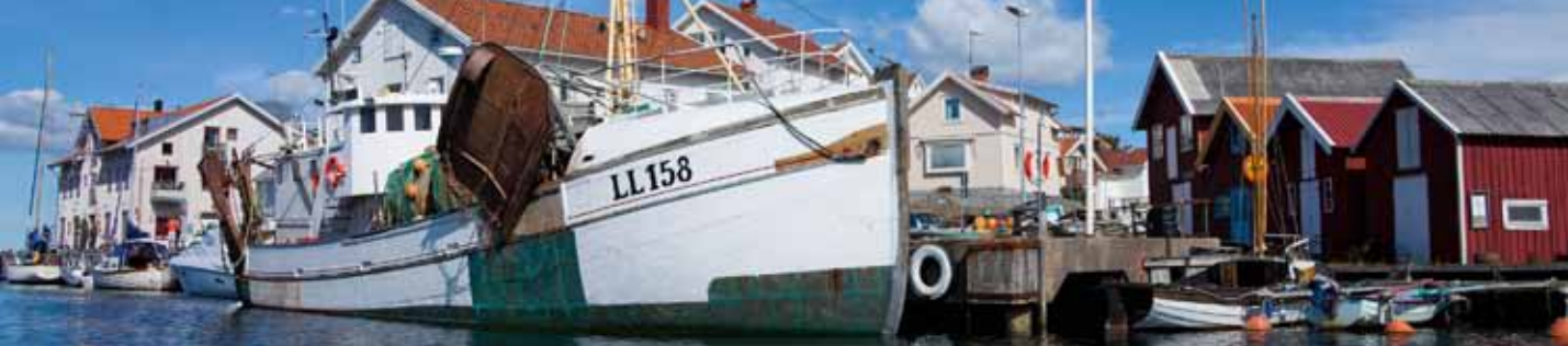
En av årets remisser handlade om den europeiska havs- och fiskerifonden.