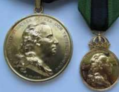
Akademiens stora och lilla guldmedalj.