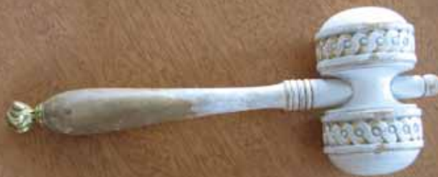
Kollegiet är akademiens styrelse och preses dess ordförande.