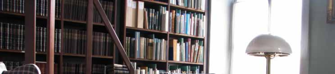
KSLA:s bibliotek är specialiserat på skogs- och lantbrukshistorisk litteratur.