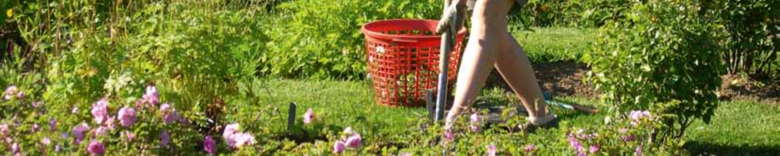
Trädgårdsarbete är en av våra vanligaste fritidssysselsättningar och har stor betydelse för folkhälsan.

former av biologisk mångfald – det senare då rovdjursförekomst i många delar av landet gör det svårt eller omöjligt att bevara betesmarkernas rika mångfald. I diskussionen framhölls bland annat behovet av ekonomiska data på företagsnivå över effekterna av rovdjursförekomst, för att det ska gå att bedöma storleken på problemen och kunna ge full ekonomisk kompensation för rovdjursskador.