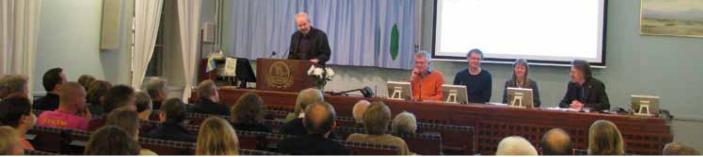
Akademiens plenival används flitigt för olika aktiviteter, här boksläpp i november 2012.