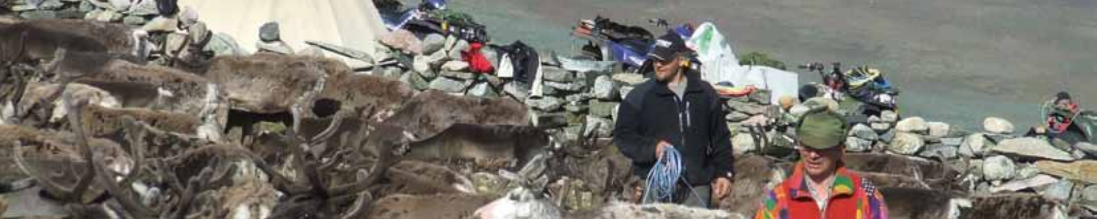
Renskötelsen bidrar till samhället i form av kött- och skinnproduktion, kultur, turism och biologisk mångfald.

att presentera pågående eller nyligen avslutade forskningsprojekt och deltagarna kom flera historiska discipliner. Vi diskuterade bland annat lantbruksvetenskapens akademiska konsolidering men också hur kunskapen om gödsling växt fram.