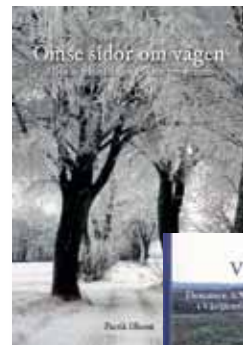
SOLMED – Skogs- och Lantbrukshistoriska Meddelanden