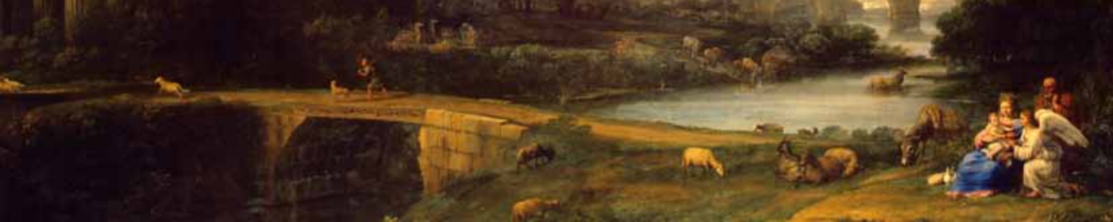
Det ideala landskapet? Claude Gellée (Le Lorrain): Landscape with the Rest on the Flight into Egypt (Ermitaget, S:t Petersburg).

den offentliga konsumtionen till miljömedvetna matval genom upphandling av måltider och råvaror togs också upp.