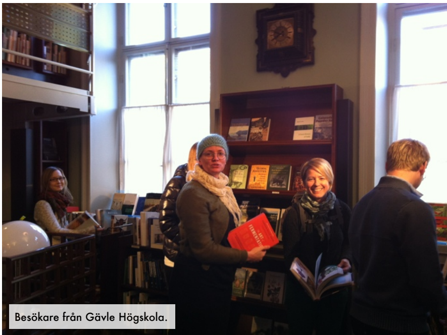
Besökare från Gävle Högskola.

arbetsmarknaden från slutet av 1930-talet, faktiskt inte fångade flera av de olika preferenser och övertygelser som fanns i det svenska samhället.