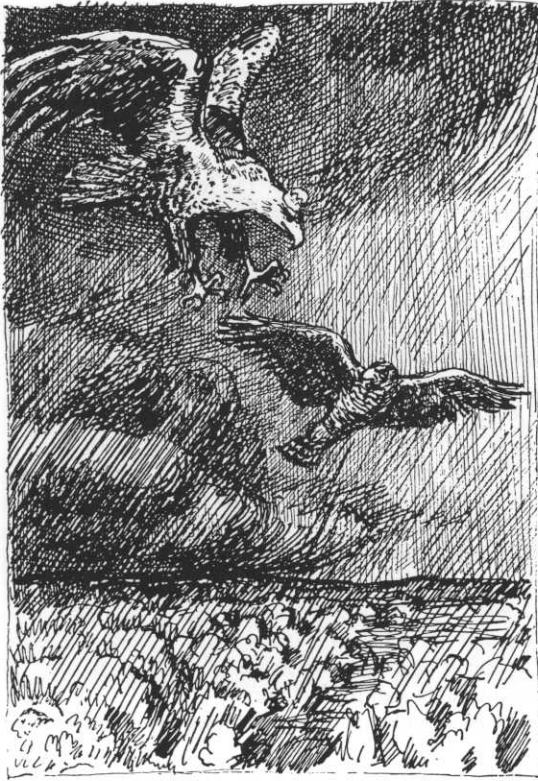
Illustration til Ørnevisen af Povl Christensen.

hvad heller jeg vil flyve eller springe, min natur skal jeg alligevel tvinge, for skytten bærer jeg ofte fare og ræddes for mangel en hoveddåre.