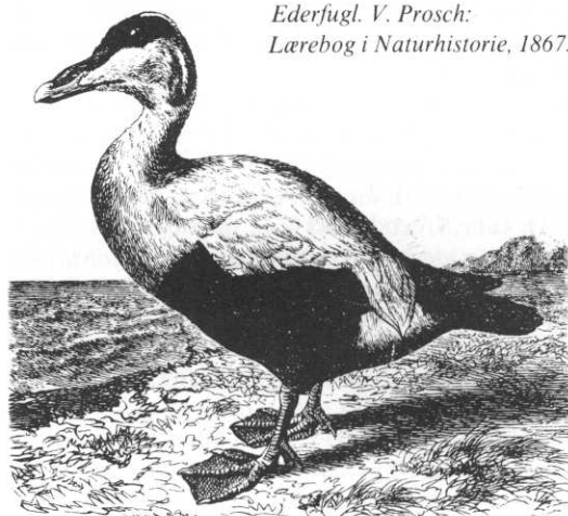
Ederfugl. V. Prosch: Lærebog i Naturhistorie, 1867.

En knogle af ederfugl fra istidens sidste afsnit er fundet i Lønstrup klit sydvest for Hjørring og er det ældste kendte vidnesbyrd om vort lands forti-