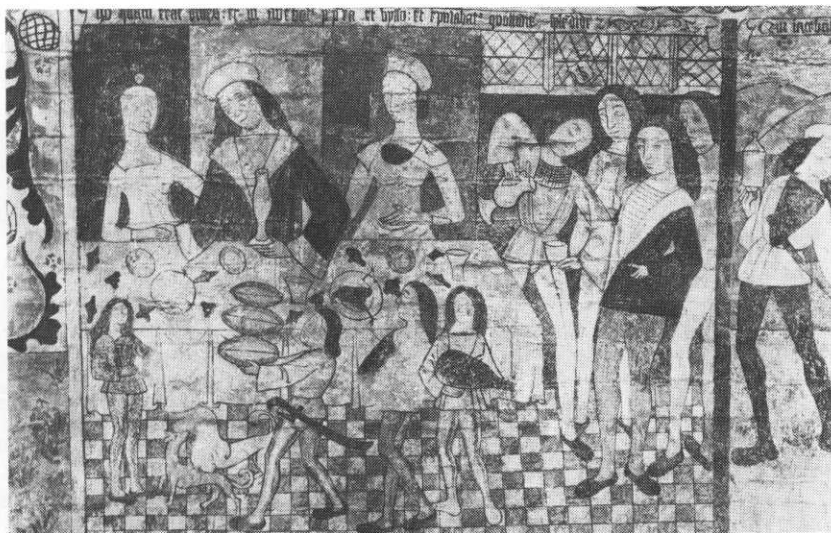
Fuglevildt serveres på de adelige borde. Kalkmaleri i Helsingør kloster.

LITTERATUR: (1) 357b 62; (2) 666 80; (3) 401h 25f; (4) 222v 93; (5) a 753k 239; b 753s 56; (6) a 910e 37; b 910e 35f; (7) 625 74; (8) 695b 73; (9) 666b 43; (10) 248 2,36; (11) 158 11, 1937-38,607; (12) 28c 17; (13) 753g 15f sml.55; (14) 333b 65; (15) 109 18.