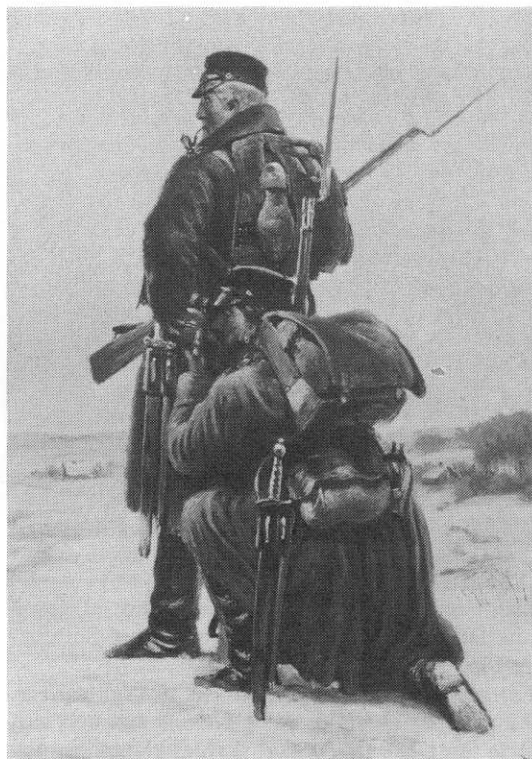
Soldatens feltflaske kaldtes en vagtel. Feltposter malet 1864 af Vilhelm Rosenstand.

LITTERATUR: (1) 659 26,252; 626 445; (2) 879 3,153; (3) 801 65; 203 405; (4) 903 3,166; (5) 281d; (6) 388; (7) 383 1,179; (8) 224 2, 15; (9) 785 235; (10) 522 46; (11) 767 198; (12) 74 27; (13) 464j 203; (14) 76b 101.