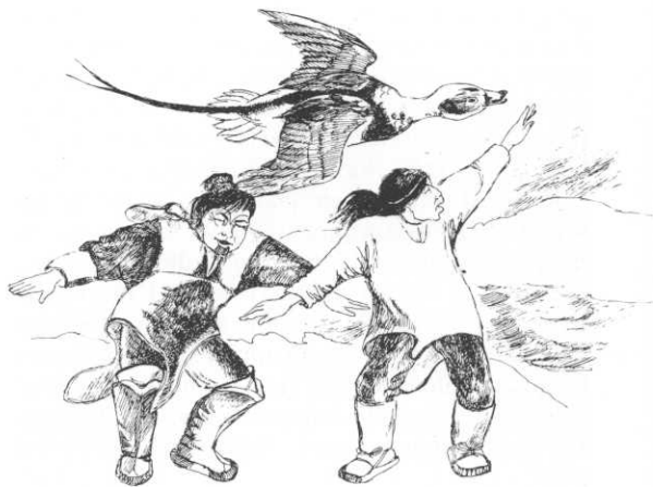
Havlittens stemme efterlignes under rituel dans for at få vindstille. Tegning af Jens Rosing i Finn Lynges Fugl og sæl- og menneskesjæl , 1981.

LITTERATUR: (1) 659 7, 985f; (2) 281c 225; (3) 170 1909,60; 434 2,178; (4) 389 1801.4,49 (Anholt); 451 382; 383 1,137; (5) 212c tb. 204; (6)