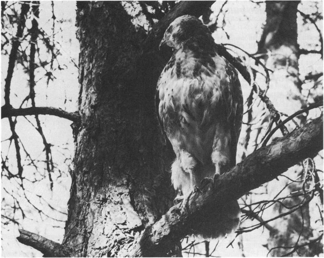
Musvåge på udkig efter bytte. Overfor: Krager efter musvåge. Træsnit af Johannes Larsen til Blichers „Trækfuglene“, 1914.

Musvågen overvintrer på bunden af tørvegrave (3).