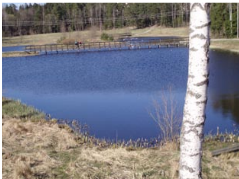
Vattenreningsystem i Tyresö.