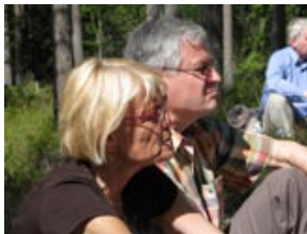
Preses och akademisekreteraren lyssnar intresserat.