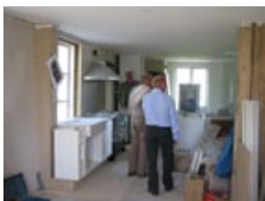
Nytt kök från IKEA med flera.