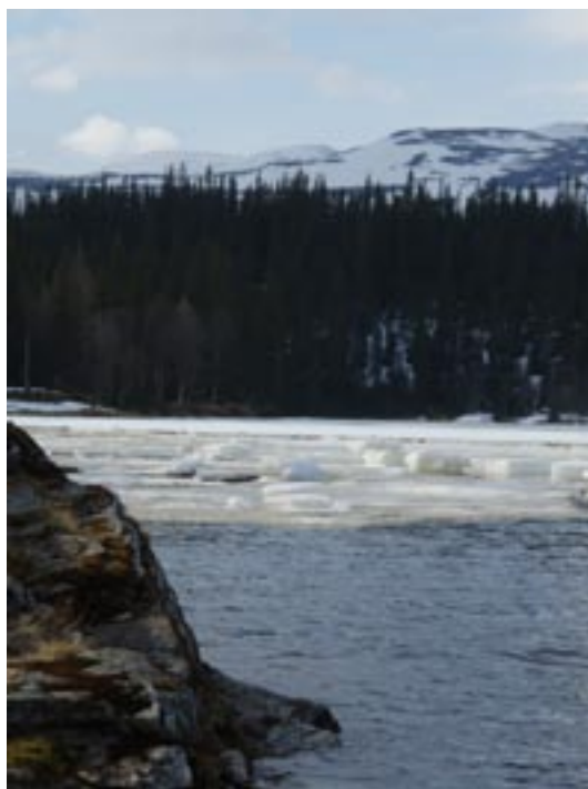
Islossning i Enan.

Vi hade styrelsemöte på Enaforsholm i slutet av april i dagarna två. Vi lade mycket tid på att resonera om den planerade renoveringen av rummen och matsalen i stora huset. Mötet beslutade att uppdra åt Arkitektur & Byggnadsvård i Kumla att leda renoveringsarbetet. Några av våra mål är att installera wc på rummen och dusch på varje våningsplan. Vi ska också få en matsal med plats för cirka 50 personer. Våra överordnade önskemål är att på Enaforsholm åstadkomma en estetiskt högklassig, vacker och bekväm miljö där gästerna trivs, dit alla vill komma