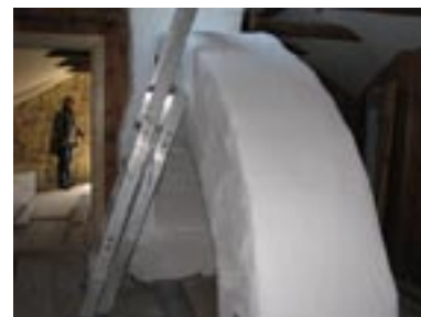
Utanför rummen behåller man vindskaktären med den speciella murstocken.