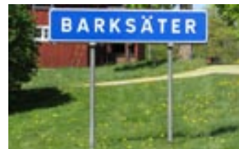
Oavsett denna skylt ska Barksätter stavas med två T i enlighet med uttal och namnets skrivning i jordregistret och i den sista jordeboken på 1870-talet.