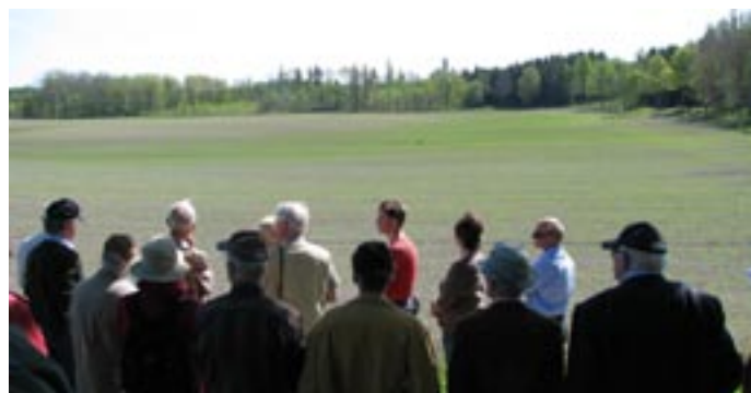
Ledamöterna ser bort mot Linjekonvaljebacken på andra sidan kornäkern. Där har man planterat fågelbärsträd, ekar i femformationer och björk – allt för att få en vacker utsikt från gården.

rättade om regeringens mål år 2010, att 20 procent av Sveriges åkermark ska vara vikta för certifierad ekologisk produktion. Idag är cirka 6,5 procent ekologiskt bedrivet jordbruk. Det är ett riksgenomsnitt och stora variationer förekommer mellan länen. Högst andel ekologisk produktion finns i Sörmland (10 procent) och lägst i Skåne och Västernorrland (2 procent).