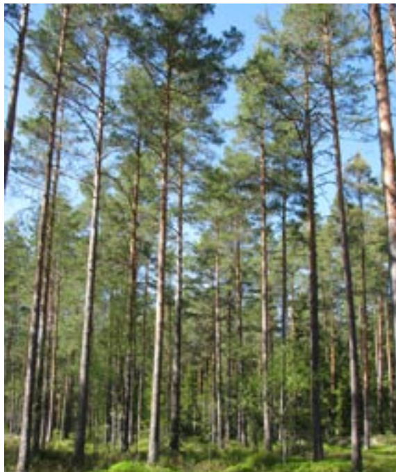
Ett Barksätterbestånd som ska gödslas inom kort.

– Kanske är staten villig att betala en del av kostnaderna för att öka inbindningen av kol i skogen och öka möjligheten att ersätta energitunga produkter som stål och betong?, undrade Tomas