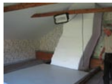
Nytt på vinden: tre gästrum plus toalett.