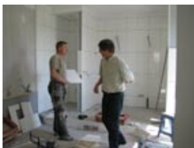
Nytt badrum med kakelugn och utsikt.