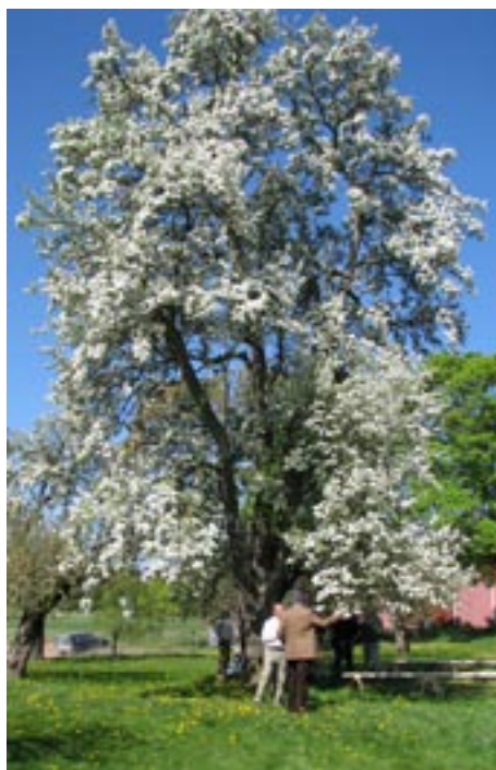
Det hundraåriga gråpäronträdet är ett vårdträd som ska stå kvar hur än omgivningen förändras.

– Det finns tre huvudtyper av äpplen – astrakaner, kalviller och renetter – och cirka 50–60 äppelsorter bara i Sörmland. Här på Barksätter kommer vi att gå in för att inte ta in för många av de