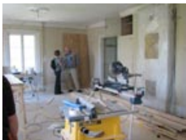
Alla husets kakelugnar är nogsamt inplastade.