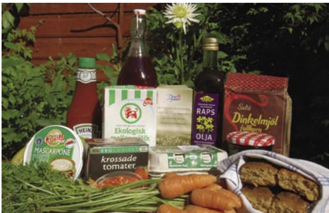
Seminariet Certifierad kvalitet från jord till bord tog upp frågor kring bland annat nyttan kontra kostnaden med certifierad kvalitet i olika led i livsmedelskedjan.

Syftet med seminariet var att initiera och fördjupa diskussionen om vad livsmedelskvalitet är i förhållande till de standarder och riktlinjer som finns. Deltagarna representerade intressenter i hela livsmedelskedjan från primärproducenter, industri, handel, myndigheter, konsumenter och forskning. Under