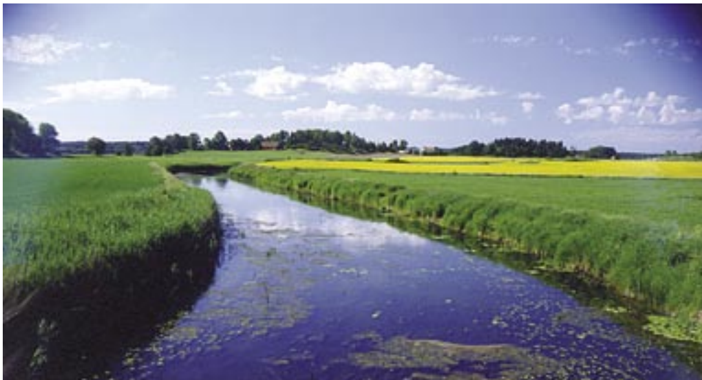
Vid Berteboskonferensen 2006 låg fokus huvudsakligen på problemet med jordbrukets användning av vatten.

Studier visar att för att utvinna 1 ton biomassa måste man använda minst 1 000 ton vatten. En konsekvens av detta är att i södra Europa används mer än 70 procent av vattenresurserna till jordbruket. Vattnet i floderna,