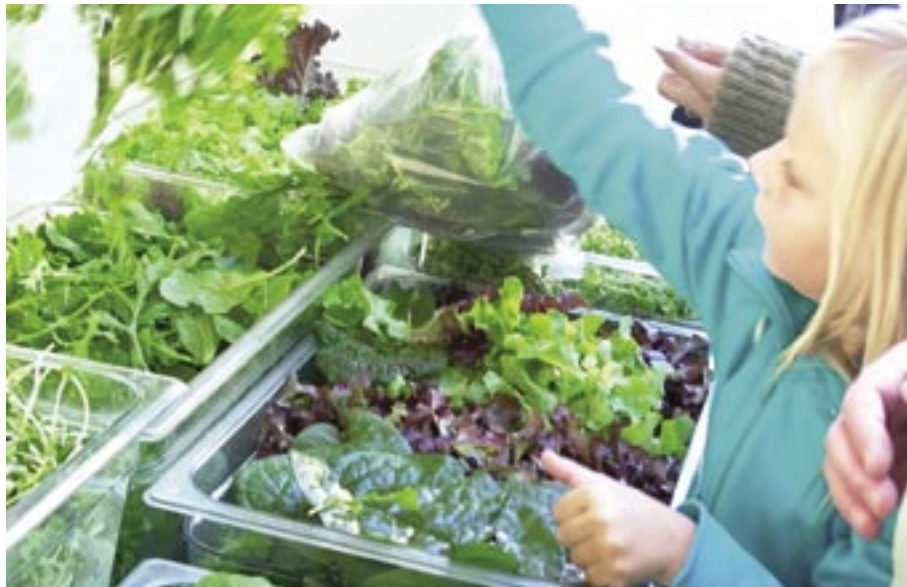
Konferensen "Det ekologiska valet" handlade om skillnaderna mellan ekologiskt och konventionellt producerade livsmedel.

Andra skillnader mellan ekologiskt och konventionellt producerade livsmedel är att ekologiska livsmedel har bättre sammansättning av fettsyror med högre halt omega-3 och högre halt av ämnen (sekundära metaboliter och antioxidanter) som anses kunna ha stor betydelse för den hälsomässiga kvaliteten i livsmedel, även om orsakerna kan vara indirekta och sambanden inte är klarlagda. Rapport finns i KSLAT nr 7/2006.