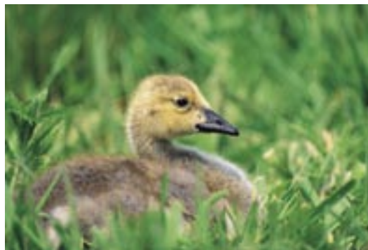
På KSLA hölls under hösten en internationell konferens om nuläget kring fågelinfluensan.

Konferensen kom mycket att handla om medias rapportering av smittosituationer. Det finns en frustration över att forskarnas och myndigheternas budskap ofta tas ur sitt sammanhang och blir annorlunda än de tänkt sig när det återges i media. Men media har andra intressen än forskare och myndigheter. Myndigheterna måste utar-