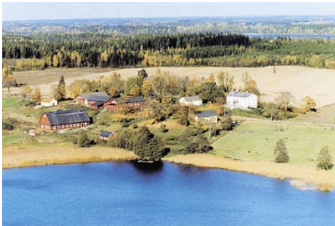
Barksätters egendom utanför Katrineholm.