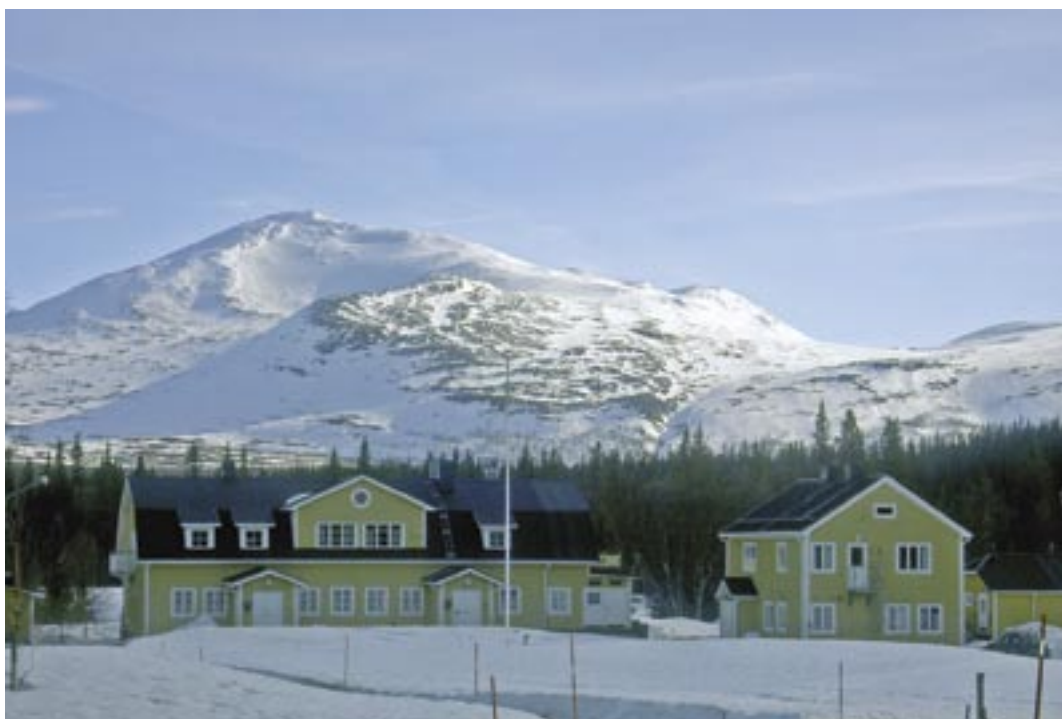
Fjällgården Enaforsholm i Jämtland.

ning som pågår måste också verksamheten utvecklas och anläggningen marknadsföras. Det nuvarande värdparet har sagt upp sitt arrende till halvårsskiftet 2007 och Enaforsholmsnämnden söker nya entreprenörer. Standarden i ett antal rum kommer att höjas väsentligt varvid olika prisklasser kan erbjudas. 2006 ordnades den traditionella Enaforsholmskursen i augusti, men också den har kostnadsmässigt blivit betydande och planeras i framtiden att arrangeras på effektivare sätt.