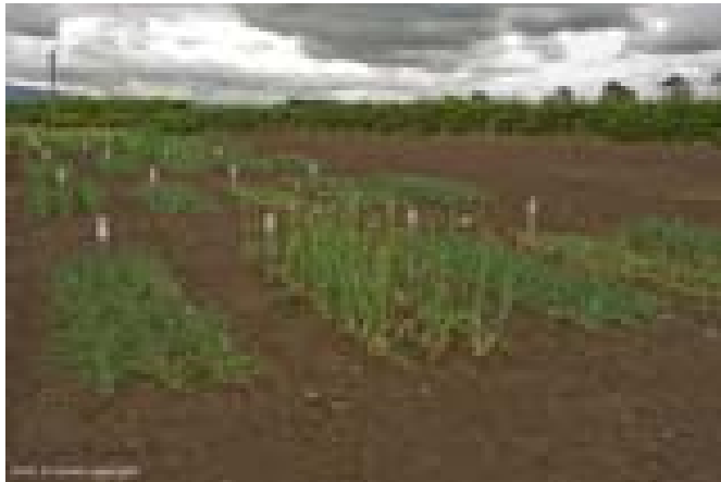
SASA i Skottland