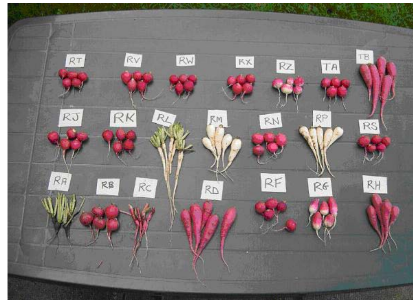
Bilderna från NIAB's försök