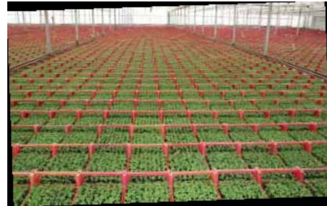
NAKT i Holland