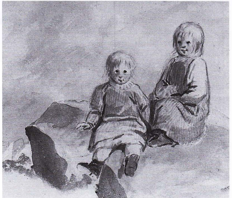
Barnstudie av Elias Martin.

Under 1700-talet hade folkökningstakten präglats av stora va-