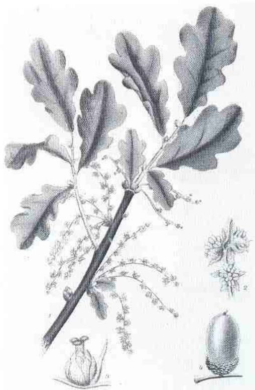
Bild 5. Ek, Quercus robur L. 1 blommande gren, 2 hånge, 3 honblomma, 4 ollon. Illustrationen är ur Bilder ur Nordens flora av Carl Lindman, Foto Kungl. Biblioteket.

fredens yrken i allmänhet. Symbolerna associerar genast till jordbruk, odling och alstrande av liv. Medaljens frånsida lämpar sig utmärkt som förlaga till ett emblem, även om ett fullständigt sådant skall bestå av bild eller figura, över- eller underskrift, så kallat lemma, och en uttolkning på vers eller prosa, explicatio. Ordet emblem kommer från grekiskans emblematura i betydelsen inlägg, flera delar fogas samman till en helhet. Akademiens emblem uppfyller inte det tredje kravet då en devis saknas. En bild utan text är dock mera ursprunglig. Den kan förstås internationellt och när utanför språkgränserna. Fr. o. m. 1939 ser man medaljens frånsida avbildad på akademiens publikationer.