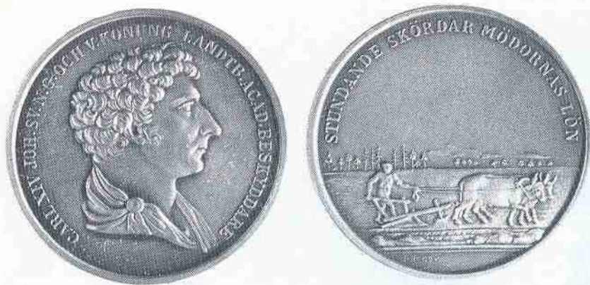
Bild 2. Kungl. Skogs- och Lantbruksakademiens jetong. Förstorad.

ett resestipendium, som tidigare innehafts av Carl G. Fehrman (kunglig medaljgravör och stilmässigt ansluten till Sergel).