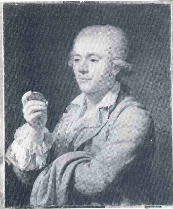
Bild 4. Lars Grandel (1750–1836). Målning av A. Wertmüller 1782. Nationalmuseum.

der den andra armen har hon en sädeskärve och i handen en skära (se bild 1), båda konkreta attribut för växtlighetens gudinna och beskyddarinna.