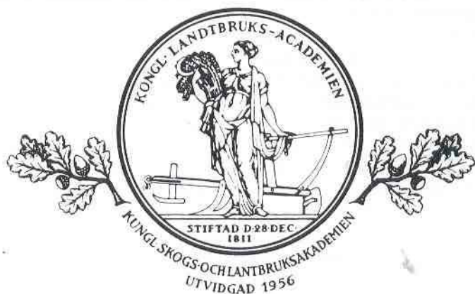
Bild 1. Kungl. Lantbruksakademiens större prismedalj (1814).

(skadad)» står det skrivet för hand i originalboken. I den tryckta tabellen som finns på Myntverket är antecknat: