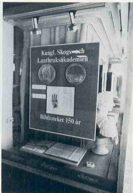
Bild 3. Utställning i Postgirots fönster, Drottninggatan-Rådmanngatan. Jubileumsåret 1981.