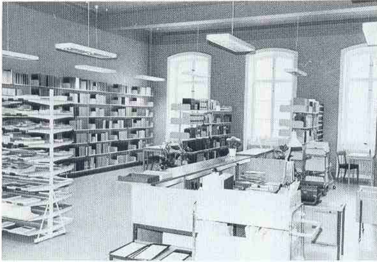
Bild 4. Bibliotekets låneexpedition.