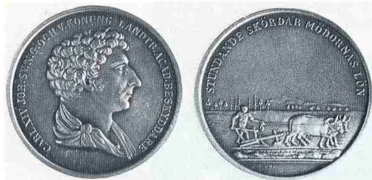
Bild 7. Kungl. Skogs- och Lantbruksakademiens jettong. Förstorad.

stadga erfarenheten, lätta utövningen och avhjälpa hindren i alla delar av lantushållningen i fäderneslandet. Dessa oavbrutna bemödanden bör vara att meddela kunskaper eller råd'. I verksamheten att sprida upplysning och meddela kunskaper, ingick biblioteket. Man gjorde redan från början betydande bokinköp både från utländska och svenska bokhandlare. Bland de svenska förekommer Fritzes namn i räkenskaperna lika ofta som än idag. Samlingarna växte också genom talrika gåvor från privatpersoner och institutioner. Bland privatpersonerna märks speciellt Sveriges dåvarande sändebud i Paris, greve Löwenhjelm, som var outtröttlig i att sända biblioteket nyutkommen fransk lantbrukslitteratur och han blev också vald till hedersledamot i akademien. ... Bland institutionerna var det framför allt Patriotiska Sällskapet donation som blev av största betydelse. Den bestod av 680 volymer, men var i realiteten betydligt större då de flesta av dessa volymer var samlingsband.