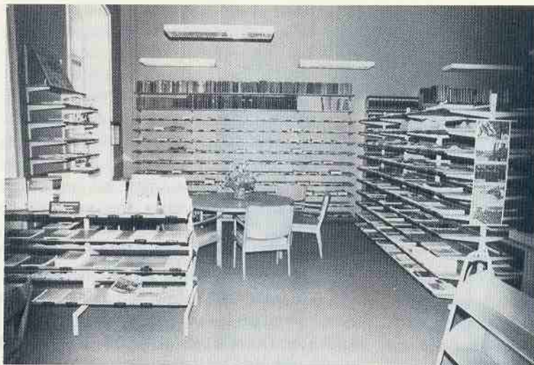
Bild 5. Bibliotekets läsesal.