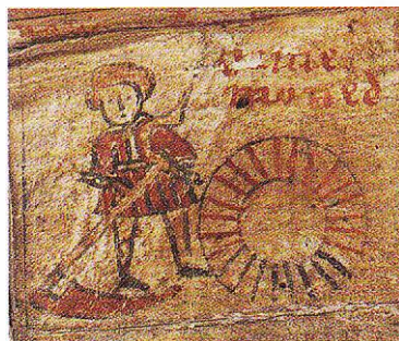
Juli, slå hö.