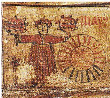
Maj, löva (maja).