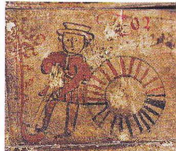
Mars, gräva (i trädgård).