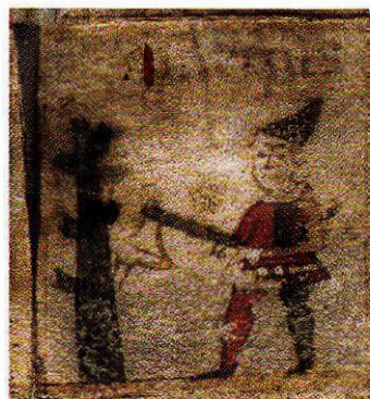
Här avbildas en man i mars månad som huggar träd i en 1500-talskopier av en medeltida, sannolikt svensk, kalender.

Den första större lärobok i jordbruksskötsel som skrevs direkt för svenska förhållanden är Per Brahes ”Oeconomia”. Brahes bok, som skrevs under 1570- och 1580-talen, spreds i handskrifter under slutet av 1500-talet och under 1600-talet. Den trycktes 1677.