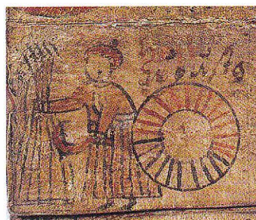
Augusti, skörda säd.

dragoxarna på bete. Lagrad säd måste omröras så att den inte brann. Smör, saltkött och fisk skulle ses till i vishusen så att de inte surnade. Vingpennorna rycks av gässen. Höladorna täcktes. Rovfrön såddes. Liarna togs fram och slåttern började.