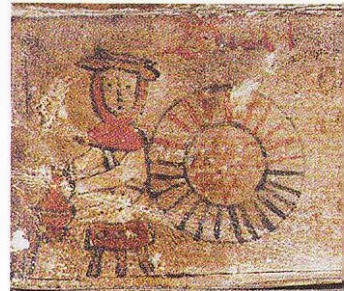
Februari, sitta (vid brasan?).

Månadsbilder med årets arbeten förekommer över hela Europa från medeltiden och framåt. Svenska kalenderbilder är delvis inspirerade av utländska förlagor, delvis anpassade efter svenska förhållanden. På denna sannolikt sydsvenska kalender från omkring år 1600 markeras också dagens ljusa timmar.