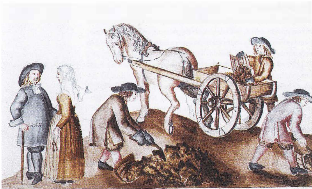
På en karta över Falu gruva från 1683 avbildas bergsmannen med hustru till vänster. Hans drängar lastar malm i en kärra.

Arbetsåtgången för bönderna i mitten av 1600-talet kan för järnproduktionen skattas till mellan tre och fyra miljoner arbetsdagar per år, och för kopparslag till omkring en miljon dagsverken. Detta betyder att förutom de som varit bergsmän, där de flesta för övrigt haft ett jordbruk att sköta, så har stora delar av den vuxna befolkningen i skogsbygderna i Mellansverige och södra Nord- sverige bidragit med arbete i järnproduktionen under en till två månader, ibland mer, per år. Männens utförde huvuddelen av arbetet, men även kvinnorna deltog. Arbetet kunde visserligen göras vintertid, jordbrukets lågsäsong, men har ändå inneburit ett kraftigt ökat arbetsuttag av befolkningen.