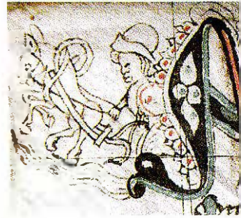
Ärjning där hästens seldon är en rankbåge. Denna detalj tyder på att denna och följande bilder kan ha gjorts i Finland. De är alla ur en laghandskrift från 1400-talets första hälft.

Sedan antiken har det skrivits läroböcker i jordbruk. I övriga Europa skrevs nya sådana på medeltiden, men i Sverige först från början av 1500-talet. Peder Månsson skrev i början av 1500-talet en "Bondkonst", och knappt ett halvt århundrade senare skrev den landsflyktige Olaus Magnus sin "Historia om de nordiska folken", ett av de mäktigaste verken i den svenska litteraturen, och den första egentliga folklivsskildringen.