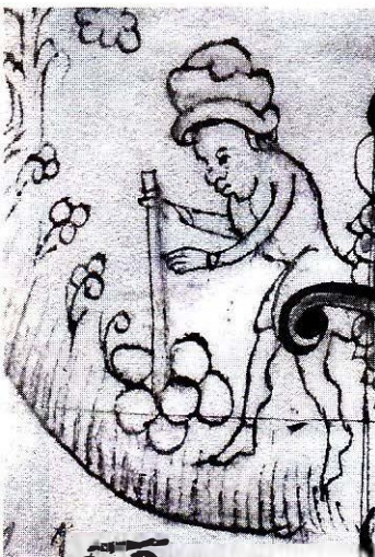
Man som olagligt flyttar på ett råmärke som står i en ägo-gräns.