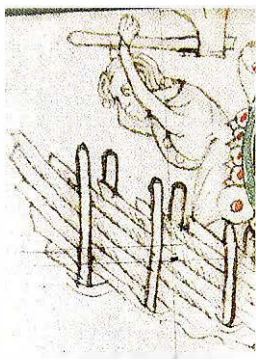
En man som buggar ned en annans gärdesgård. Då han greps tog man yxan ifrån honom och sedan fick han böta.

maktkamp, där den stora bondemenigheten inte var utan inflytande. Dessutom medförde en rad tekniska och ekonomiska nyheter under den stora omvandlingen att bönderna hade behov av fasta-re lagar och nya regler.