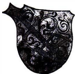
Högårder från Kumla, Västmanland.

All religiös konst har av religionen förutbestämda element. Exempelvis är åsnan vid Jesu krubba inte något belägg för att det funnits åsnor i Norden.