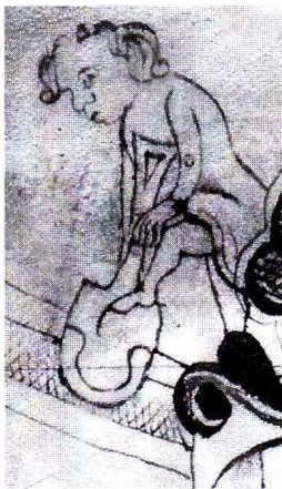
En man gräver dike och har lagenligt gjort dikesrenar.