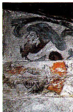
En bjälke har skyddat den medeltida färgprakten och den röda färgen har inte svartnat. Härkeberga kyrka i Uppland.

Konstnären och hans uppdragsgivare, både under tidig medeltid och senmedeltid, placerade motiven i sin egen samtid. Konsten hade ett lärande syfte, och bondebefolkningen tog lättare till sig budskapet om figurerna placerades i en känd miljö. Det finns dock flera källkritiska problem med kyrkokonsten.