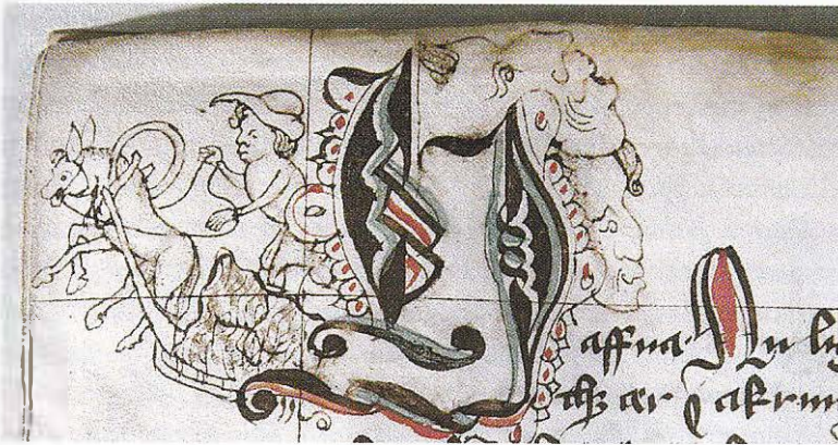
Slädtransport bredvid bestämmelse om sädeskör och höskörd, vilket visar att det är en sommarsläde.

Stjäl någon höräfsa eller hävel, lässestång eller krokrep, tömmar eller selar ute på ängarna, böte han en öre för vardera. Detta är bondens ensak.