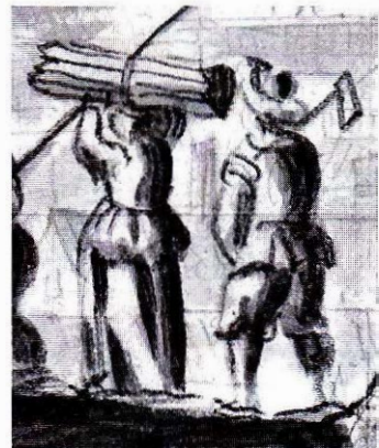
Man och kvinna som hämtat ved. Han bär på yxan.