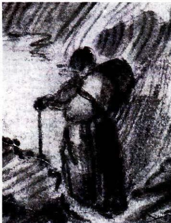
Kvinna med börda på ryggen, på väg i Uppland år 1661.

ingripa. Efteråt kom pigan ut ur skogen och körde hem lasset. Den dramatiska historien är viktig som en skildring av manligt förtryck, men också rent agrart eftersom flickan utförde ett arbete vilket normalt betraktas som tillhörande den manliga sfären.