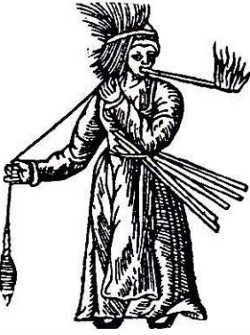
Kvinna med slända och pärtstickor. Spånadsmaterialet, troligen lin, har hon fäst i ett band kring huvudet.

nalt. Om det skett en förändring under 1500- och 1600-talen kan bara avgöras genom en brett upplagd studie av räkenskaper.