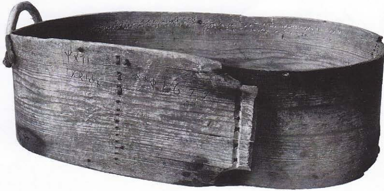
En såskäppa från 1677. Denna spånkorg hölls med den vänstra handen medan man sådde med den högra.

En helt annan genre med anknytning till allmogens liv var psalmerna i den nya Psalmboken från 1690-talet där flera var präglade av tidens hungersnöd.