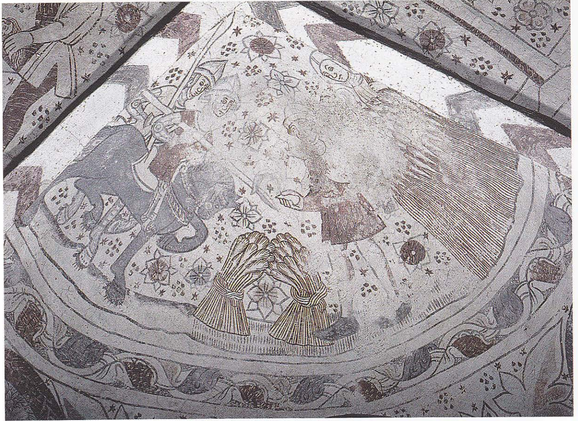
Skördeundret i Norra Strö, Skåne, 1450–75. Till höger bondeparet. I mitten maten – två kärvar ställda mot varandra. Kärvarna ska bli en lång trave. Till vänster Herodes soldater. Soldatens lans och bondens skära korsas, som av en slump.