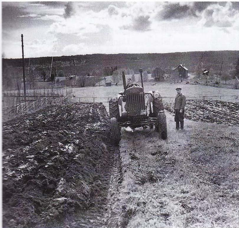
Kanske väcks den första tanken på att själv bli bonde när man stolt rattar traktorn under pappas uppsikt. Solberga, Dalarna 1952.

Vi började att köra driften ihop -73, och sen köpte jag arvegården. Det kunde ha varit -81, och sedan köpte jag resten av gården. Det måste varit -90. Det var väl den gången dom höjde taxeringsvärdet. Sen tog jag över driften och alltihopa -91. Då har inte pappa varit med i det längre. Före dess då körde vi ihop.