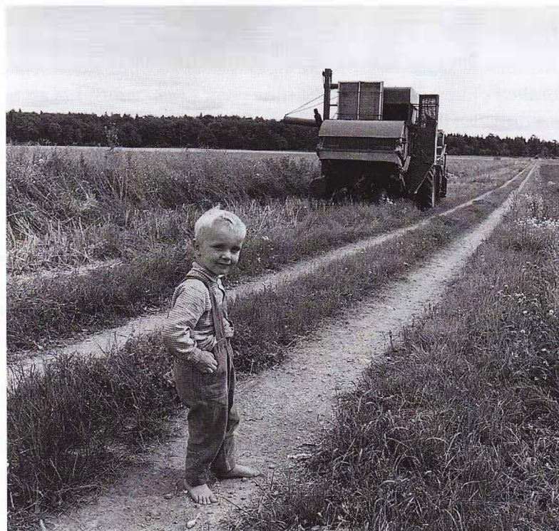
Gårdens framtida arvtagare formas i de vardagliga sammanhangen. Blekinge, 1960-talets början.

Under den period som behandlas i boken har vi grovt räknat att göra med tre generationer. Den äldsta består av dem som blev bönder under 1940-talet, mellangenerationen blev bönder under 1970-talet medan den yngsta generationen fortfarande trampar i farstun. Det är påfallande hur den som tagit över en gård, liksom den som planerar att göra det, framhåller sig som den i syskonskaran som varit mest intresserad och tidigast begiven på jordbruksarbetet. Det är också den bild som föräldrar och omgivning tecknar. Framför allt är berättelserna i dag uppbyggda kring hur tidigt man körde traktor, medan de för den allra äldsta generationen i stället är arbetet med häst som lyfts fram. De bildar centrala