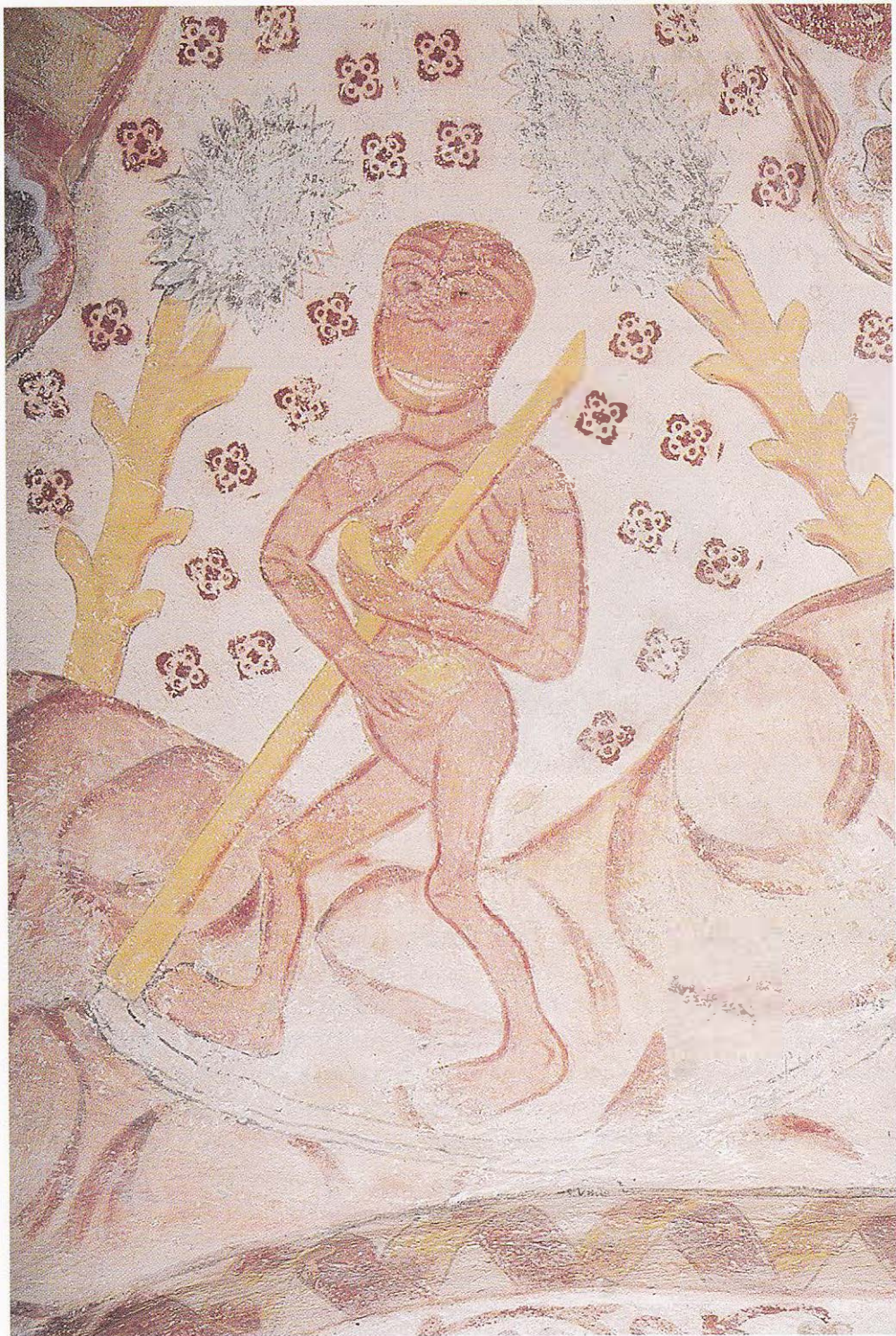
Liemannen i denna uppländska kalkmålning från omkring 1500 går fram i landskapet med en stjärtorvsle med långt blad.