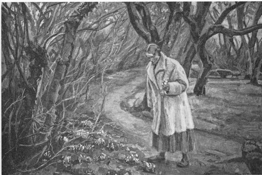
Det tidlige forår bebudes af de hårdføre løgplanter som vintergæk og dorothealilje, der lyser hvidt mod træernes mørke bark. Den fynske maler Fritz Syberg har skildret dette sceneri i sit forårsbillede »Dorothealiljerne blomstrer«, 1926–27. Statens Museum for Kunst.