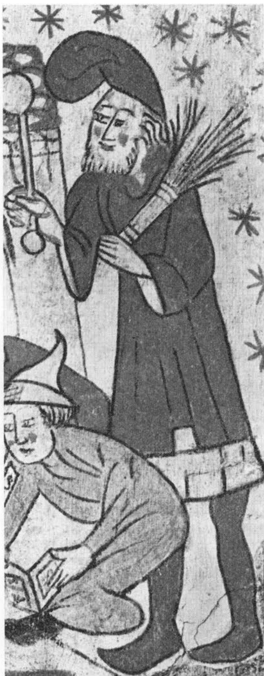
Skolemester med birkeris. Kalkmaleri i Tuse kirke ca. 1475.

Veddets anvendelse efter 1900: vognstænger, drejer- og snedkerarbejder, bygningstømmer, brændsel, tøffelbunde og træsko (især MJyl-land), skeer, skomagerpløkke, nu mest til møb-ler, parketstave, krydsfinér, i øvrigt børster, dolke, emballage, geværkober, hegn, legetøj,