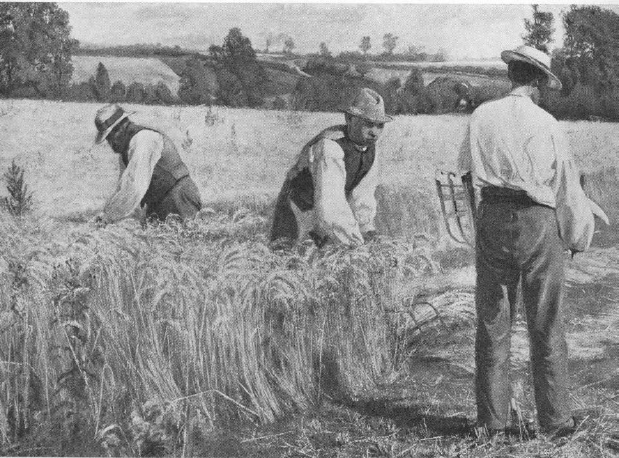
Byggen mejes af mejere fra gården »Rågelund«. Maleri af L. A. Ring, 1884. Privateje.

Det bliver en god byghøst, når marken har stået