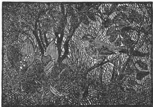
Træsnit af Johs. Larsen af nattergal; begge fra St. St. Blicher: Trækfuglene, 1914.

19). Sidder lusene (»ungerne«) på skarnbassens forkrop, skal man så tidligt, på bagkroppen er silde sæd det bedste (20).