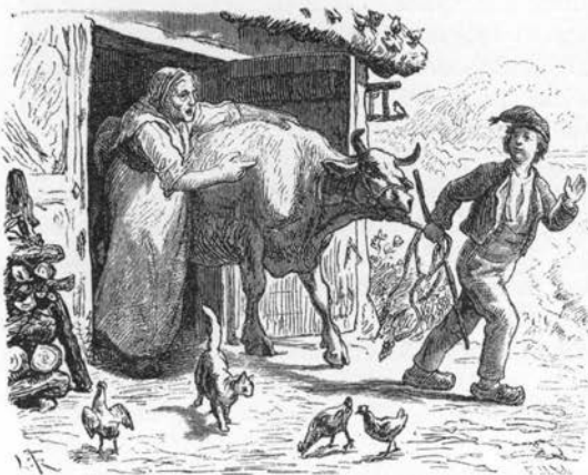
Ko trækkes af stald ved forårstide. Vinterfoderet var ofte så ringe, at dyrene måtte bæres på græs. Træsnit af Lorenz Frølich i Ude og Hjemme 22-12-1878.

1850; 28). Hest med indvortes sygdom skal have byg kogt med hønsemøg i vand (29), mod krop og kværke maltet byg (Ribe amt; 30), kogt varm byg i muleposen (31) eller samme i pose på mulen (Als; 32).