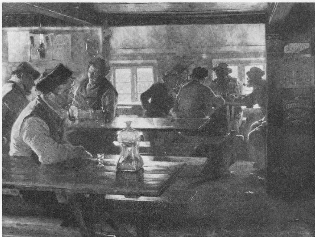
Fiskere forsamlet i skænkestuen på Skagen kro. Hjemmebrændingen og de meget lave snapsepriser gav store alkoholproblemer i alle samfundslag. Manden i forgrunden skæver længselsfuldt efter »klukflasken«. Maleri af P. S. Krøyer, 1886. Privateje.

kunne æde (26). – Efter jul måtte der ikke fodres med byghalm, ellers kunne kvæget ikke selv rejse sig (VJylland; 27), sml. lægeråd nedenfor.