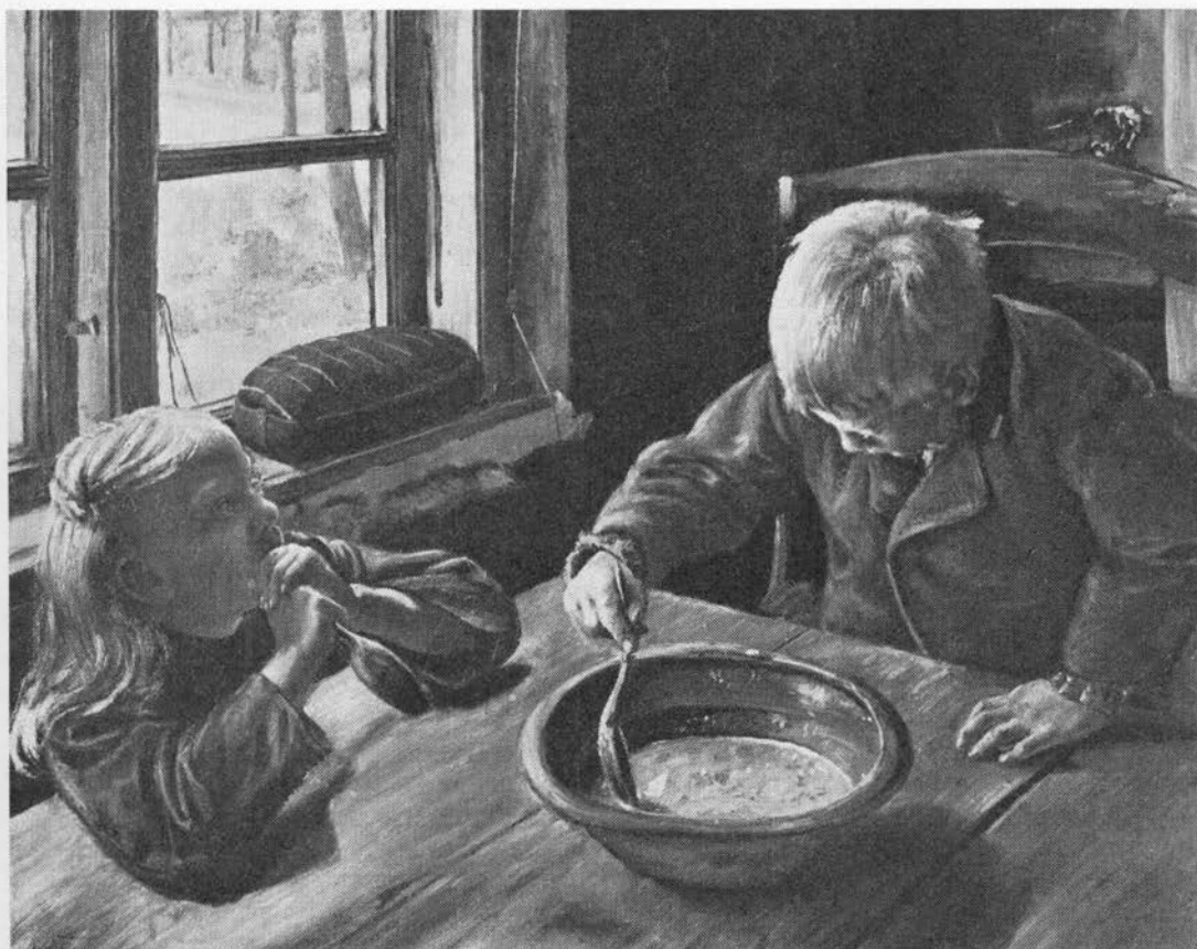
Børn omkring det fælles grødfad. I vindueskarmen et nybagt brød sat til afsvaling. Maleri af L. A. Ring, 1884. Privateje.

Byg anbefales 1820 som hestefoder i stedet for havre (24). Fodring med bygavner (-stak) var almindelig, skønt de havde ringe næringsværdi og kunne give dyrene fordøjelsesbesvær og mundbetændelse (25). Når hestene fik hakkelse af byggen, satte avnerne sig ofte fast i kødet mellem tænderne og gav betændelse, så dyret ikke