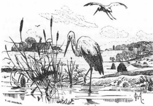
Dunhammer i mose. Tegning af O. Hermansen, 1878. Kobberstiksamlingen.