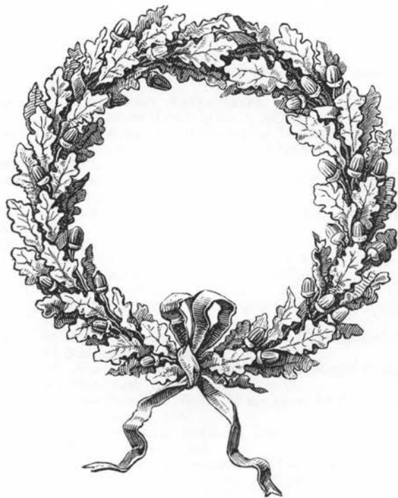
Guld-egekransen på kong Frederik 7.s kiste. Illustreret Tidende 20-12-1863.