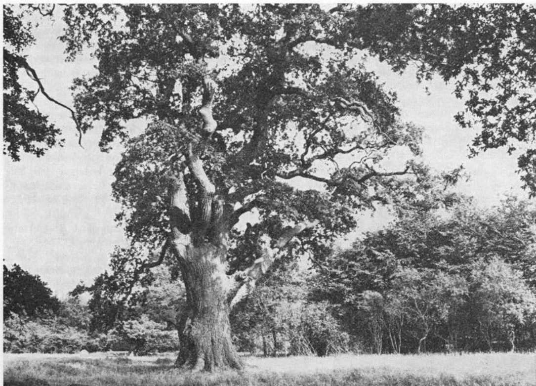
Christian den Femtes Eg. (ES).

34 Christian den Femtes Eg ved Femvejskrydset i Jægersborg Dyrehave. Ved træet blev kongen