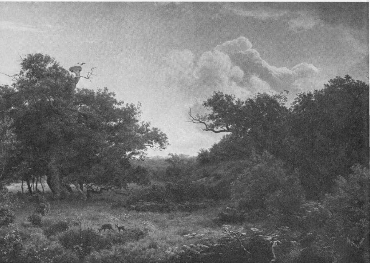
»Parti af Nordskoven ved Jægerspris«. Maleri af P. C. Skovgaard, 1843. Statens Museum for Kunst.

tre forsmåede prinsesser svor G.s undergang. En anden overlevering sætter egne i forbindelse med Struensee og hans fald, hvorfor de også er kaldt Struensee-Egene , (357 27; 360 1,1914,166 og 4,150); nu kun ét (stærkt hældende) træ tilbage (930b 10.3,1967,1135). To helt sammen-groede og -slyngede træer (eg og bølg) i parken skal være plantet af Struensee og dronning Caroline Mathilde (885 11,1934,185), sml. nr. 104.