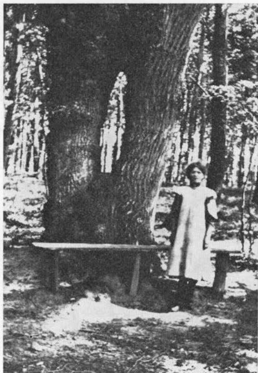
Det kloge Træ i Davrup skov ved Holbæk.

679 1,181 (1871); (11) 885 16,1939-40, 98 og 18, 1942,222f; 161 1906/23: 3341; 278 1929,94; 186 30; (12) 488j 6,320; (13) 885 14,1937-38,124 jf. 18,1942, 222f; (14) 885 11,1934-35,67 og 20,1944,37; (15) 879 58; 278 1931,137 og 1932,141; (16) 161 1906/23: 627; 483 21/12 1893; (17) 466 372; (18) 891 100; (19) 333h 19f jf. 159 1932,33ff; 891 111; (20) 611 200; (21) 488o 66f; 228e tb. 63 jf. 488i 4,578; (22) 519 128; (23) 139 1,1890,3f; (24) 488i 4,578, 488j 4,434; (25) 642 54; (26) 488i 5,578; 488j 4,434; 161 1906/23: 246; (27) 141 190; 24c 15; 161 1906/23:281,314; 253 1923,193-95; 1931,87; 1950,98f; 269b 1,322f; 159 1932,45f; 107 1965; 173 1940-41,8; (28) 742 12; 635 19/8 1889; 139 1,1890,2f; 488j 4,434f; 830 1886,201; 159 1932,48-51; 269b 2,282-85; 1009 19, 1930,59-65; 630 15/1 1966; (29) 141 3. udg. 2, 1879, 106; 409 1881-82,339; 635 19/8 1889; 161 1906/23: 547; 141 1,3; 1009 1930,62; 159 1932,51f; 109 6 & 13/6 1966; Olav Evensen, Klude-egen i Lestrup skov, 1968; (30) 333h 20f; 64 20/1 1945; 551 28/7 1967; (31) 161 1906/23: 601 (1914); (32) 549 111; (33) 546 24,1936,133; (34) 822 105; (35) 161 1930/5: