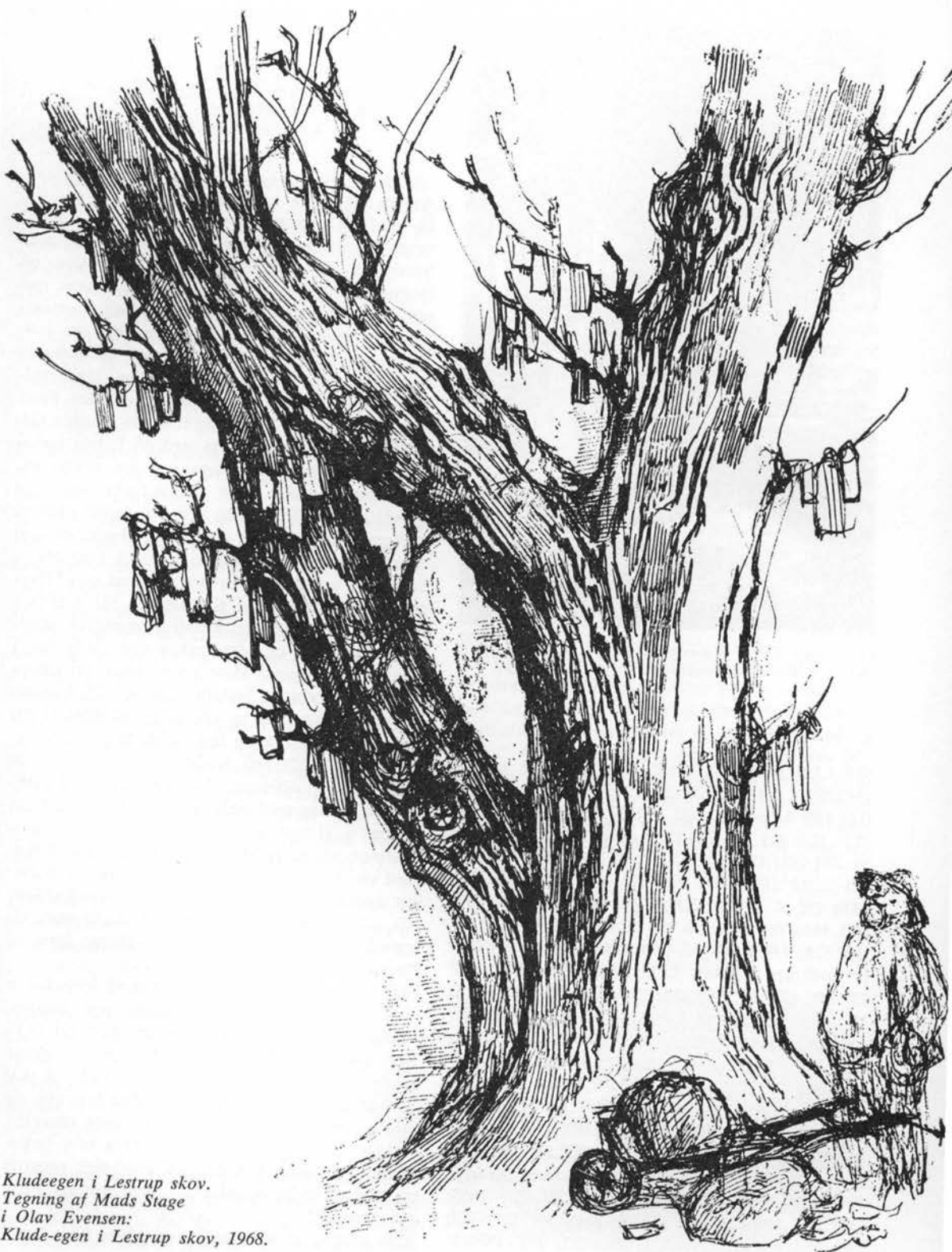
Kludeegen i Lestrup skov. Tegning af Mads Stage i Olav Evensen: Klude-egen i Lestrup skov, 1968.