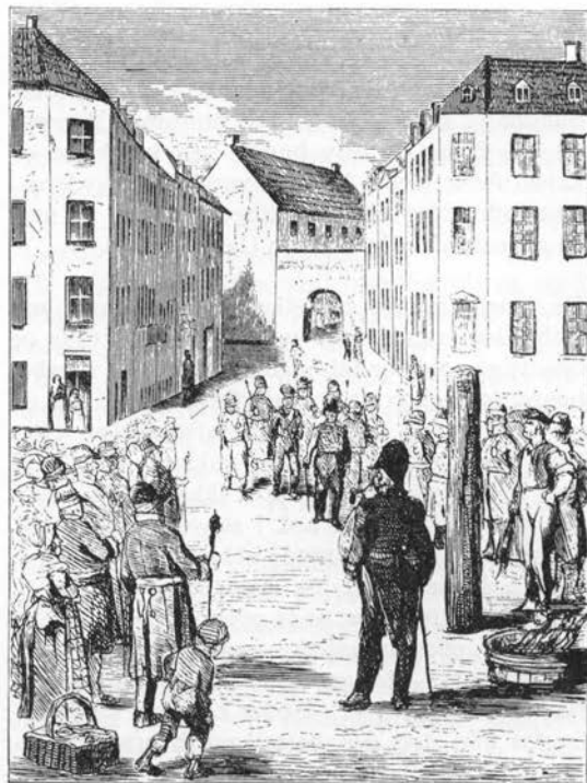
Kagstrykning. Træsnit af P. Klæstrup i »Det forsvundne Kjøbenhavn«, 1877.

Tynde grene afstivede gravkranse (Sønderjylland o. 1890; 33) og blev i Jylland flettet til sædekurve, kurve, kurvemøbler; over flækkede grene – skinner – blødgjort i vand bandt man