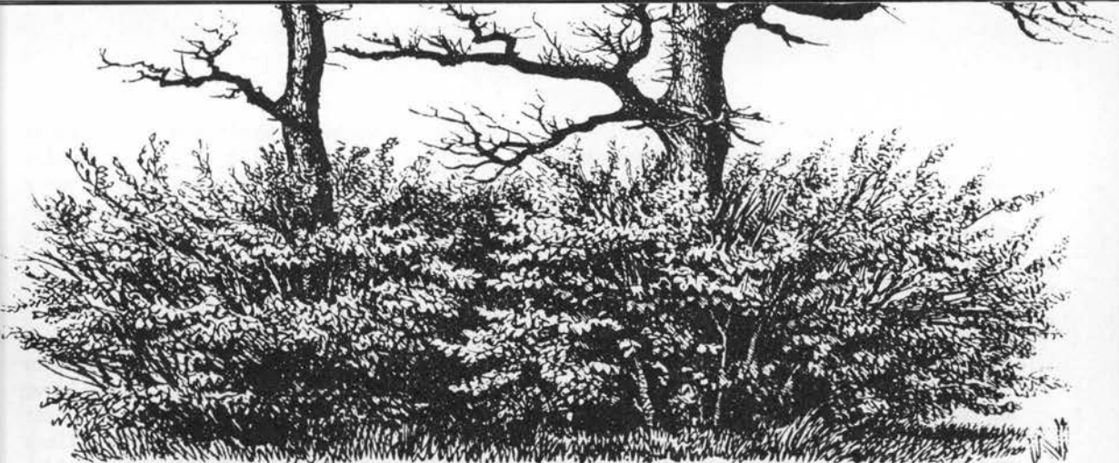
Egetræer med hasselunderskov. Chr. Vaupel: De danske Skove , 1863.

1700-t, fra oldnordisk, beslægtet med ham, hinde; fas , fasa Bornholm 1744ff, Sønderjylland ( fase ) jf. norsk fassa , dansk fase = trævl; vos Fyn, kys Lyø (af kyse = hætte?), nøddehus Birkholm, bus ØLolland jf. busse = bøsning; skærm Femø.