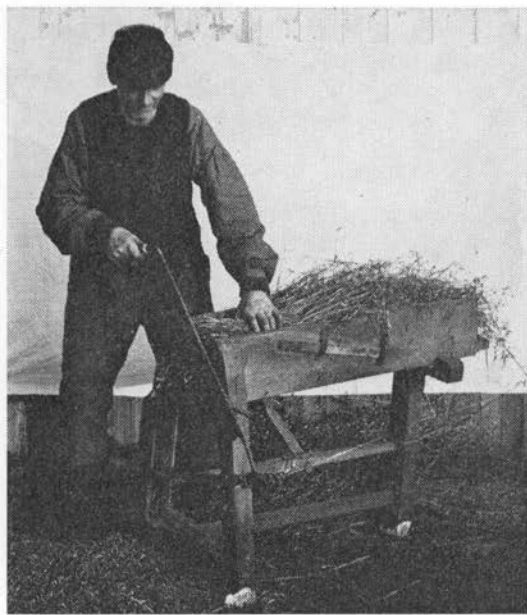
Bonde skærer hakkelse ved »hakkelseskisten«.

neg, den såkaldte rose , til at si urten fra masken (Als; 2).