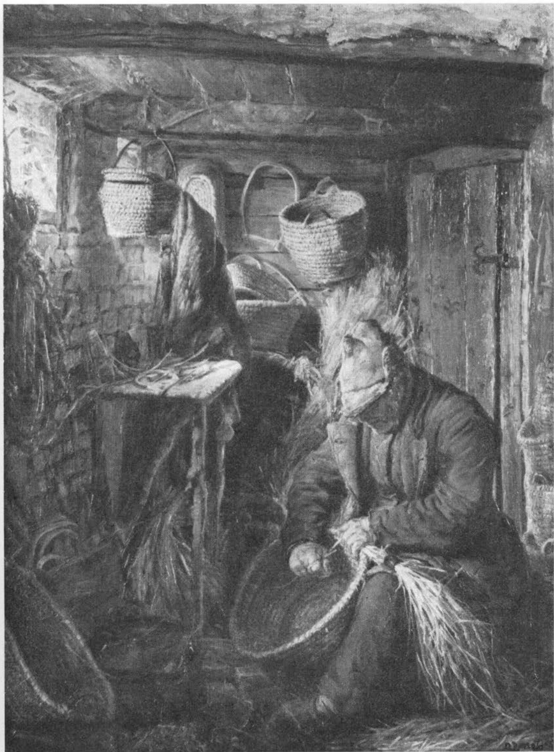
Gammel løbbinder arbejder på en kurv i sit værksted. »Bindingen«, der ses på mandens knæ, holder stråene tæt sammen under arbejdet. Maleri af N. P. Mols, 1883. Privateje.