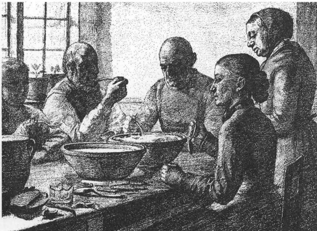
Omkring det fælles grødfad.

industri som en velstandskilde for landsbyens bønder; de forarbejder ikke blot den bedste havre af egen avl, men køber store portioner på torvet eller skibene i København, flere gårde fremstiller op til 20 tdr. havregryn om ugen. Af-faldet går til fedesvin og fjerkræ, skallerne giver et bageovnsbrændsel (11).