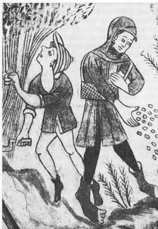
Såning og høst skildret på middelalderligt kalkmaleri i Reerslev kirke.

igen (1848ff; 7). Kan man i maj med udstrakt finger nå mellem to hvedespirer eller finde dem med lygte, er der planter nok til en god afgrøde (Jylland; 8), det samme gælder, om man St. Hans aften kun finder tre hvedestrå (MSjælland; 9). Man skal ikke rose hveden, før den er høstet; »ros ikke hveden i blade · før du har den i lade« (VJylland, Sønderjylland; 8).