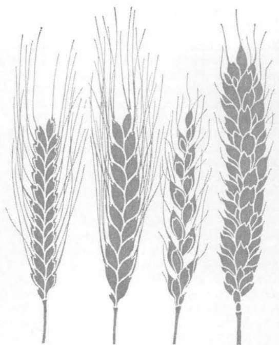
Enkorn Emmer Spelt Alm. hvede

Dyrket i Danmark siden yngre stenalder, først som emmer , enkorn , alm. og tetakset hvede, og spelt fra begyndelsen af vor tidsregning; emmer forsvandt nogle århundreder før Kr. f. (2). Ar-