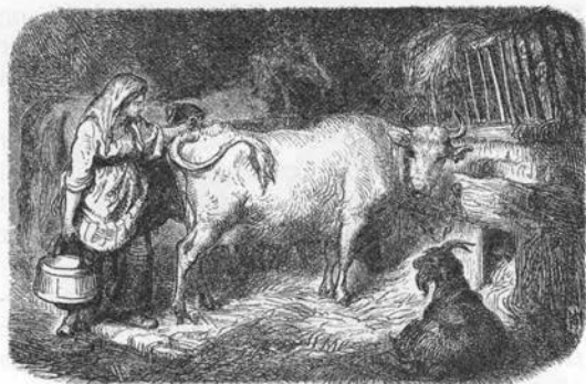
Kreaturene fik kalmusrod som kosttilskud for at forbedre mælkens kvalitet. Tegning af Lorenz Frølich i Ude og Hjemme 12-11-1882.

banghed«; dårlig ånde fordrives, når man tygger på den tørrede rod, i pesttider gør den luften sund; pulveriseret og drukket i kørvelvand som sveddrivende for at »løsne det blod, som er løbet sammen« efter slag og stød.