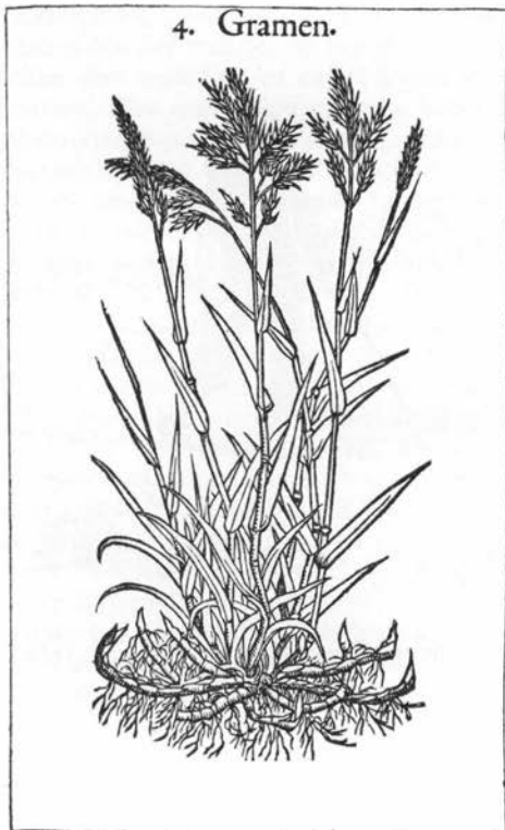
Kvik fra Simon Paulli: Flora Danica, 1648.

kvik, for her skulle køerne græsse om sommeren (Møn; 3).