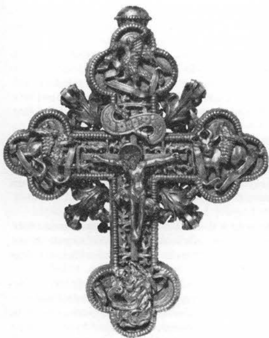
Brudgoms kors med krucifiksets ender udformet som stiliserede liljer. Middelfart Museum.