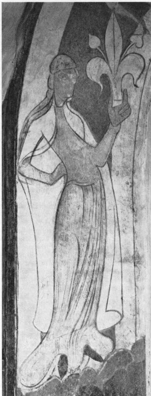
Middelalderlig kvinde med »fransk lilje«, opstandelsens symbol. Kalkmaleri i Sdr. Nørå kirke, Fyn.

og med liljebanner i hånden; før 1400 havde byens mærke sandsynligvis kun én lilje, dens ældste kirke var viet til jomfru Maria, som blomsten symboliserer. Den er tidligst anvendt på kongescepteret i Erik Lams segl 1140 og Valdemar Sejrs 1216, siden i de fleste middelalderlige kongesegl (1). Der findes tre liljer i Holmans herreds våben 1584–1655 (4), helt fra nutiden stammer de tre liljer i Glostrup kommunes våben (1940), der står for kommunens tre gartneri- og havebrugsbyer Ejby, Hvissinge og Avedøre. Børkop kommunevåben 1975ff har vandmøllehjul omgivet af tre søvliljer. – Det danske Spejderkorps, stiftet 1909, har en heraldisk lilje som korpsmærke.