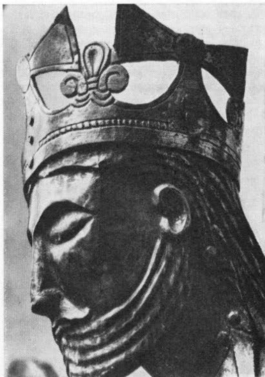
Den korsfæstede Kristus med liljekrone, krucifiks ca. 1150. Tirstrup kirke.