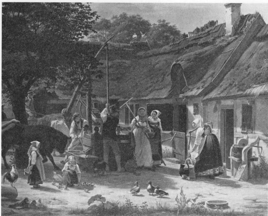
Mosbevokset stråtag på sjællandsk bondegård. Der fandtes ofte en rig flora på gårdenes tage, således ses på rygningen en række husløg. Maleri af Peter Julius Larsen, 1852. Statens Museum for Kunst.

LITTERATUR: (1) 839 8f; (2) 488j 4,216; (3) 785 1,1868,246; 839 8f; (4) 328f 2,27; (5) 488i 6,2,229; (6) 570 90; 228e 2.614; (7) 85 52.