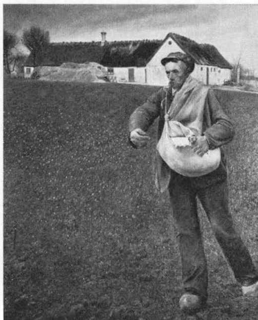
Bonde spreder vintersæden. Maleri af L. A. Ring, 1910. Privateje.

Rugen skal man harve fra sig (let), havren til sig (dybt) (1), og den kunne ikke sås for tykt, selv ikke dér, hvor man faldt med sædekurven (24). Kærnerne sagde: red godt under mig, så skal jeg nok hytte mig (1688ff; 25); læg mig tør og læg