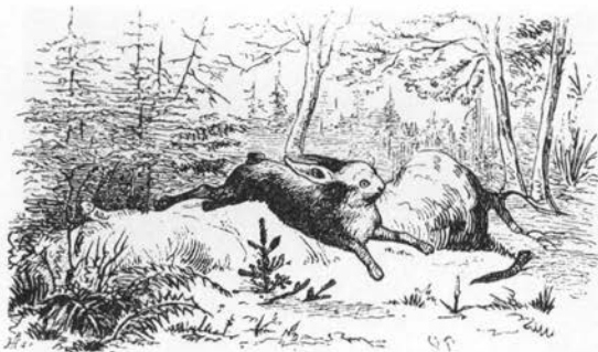
Vilhelm Pedersens illustration til H. C. Andersens »Grantræet«.

af et dansk juletræ er fra 1842; to år efter skrev H. C. Andersen eventyret om Grantræet som juleaftens midtpunkt. Han og andre digtere (Inge-mann, Heiberg, Grundtvig m.fl.) bidrog meget til skikkens udbredelse (10). · Paradis! drømt så mange gange! · Skønne træ, træ foruden slange, · juletræ! · Chr. Richardt (11).