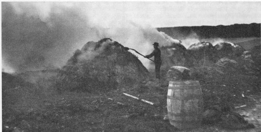
Kulmiler ved Rebild hvor brændet til milerne hentedes i de store jyske granplantager.

drejer sig dog snarere om birkebeg. – Man har støbt lys af harpiks og talg (19). Nu anvendes nåletræers harpiks bl.a. i fabrikationen af sæbe, terpentint, fernis, podevoks, asfaltemulsion, seglak, papirlim, bindemiddel i piller, vognsmørelse, belægning på strygeinstrumenters buer, pulveriseret til brug ved skoldning af fedesvin og fjerkræplukning.