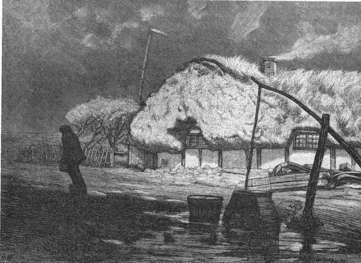
Gård på Læsø med det karakteristiske tykke tangtag. Træsnit efter maleri af Lauritz Tuxen. M. Galschiøt: Danmark, I, 1887.

1878 anslås, at der langs Danmarks kyster kunne bjærges 50 millioner kg tør tang (mest bændeltang) til gødning, fra Limfjorden alene 10 mill. kg (3).