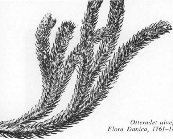
Otteradet ulvefod. Flora Danica, 1761-1883.

Poser med sporestøvet som omslag på podagra (1772; 2), det er også anvendt mod tandpine (3) og strøet på (især småbørns) hudløshed (4); det vandskyende pulver bruges i børnepudder og overfladebehandling af piller, så de ikke klæber sammen, endvidere til pudring af kondomer, modelstykker i jernstøberier (5). Til apoteker er indsamlet »heksemel« ved Frederikshavn og på Bornholm, men størsteparten indføres, navnlig fra Rusland (1910; 6). Sporestøvet anføres i farmakopeen 1772, dette og urten føres på apoteker.