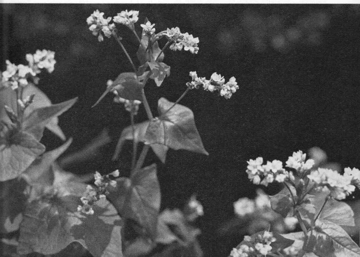
Blomstrende boghvede. (ES).

I 1700-t er rug og boghvede mange sønderjyske sognes omtrent eneste sædafgrøder; bønderne vægrer sig i begyndelsen ved at betale tiende af boghveden med den begrundelse, at det ikke er en rigtig kornsort og derfor ikke kan falde ind under de gamle bestemmelser (11). Skønt høsten er usikker, f.eks. fryser boghveden ofte bort (sml. s. 139), giver den på magre, kalkfattige jorder et ret godt udbytte og er en af de