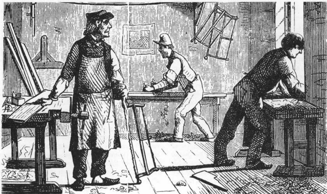
Tegning af snedkerværksted i Folkekalender for Danmark, 1861.

Efter 1900 er elmens ved (især småbladet elm) mest anvendt til møbelfinér (navnlig masret »elmerod«) (9), i øvrigt til bl.a. vognhjulsdeler, karosserier, dæksplanker, skibsaptering, spanter, årer, stævn, bjælker, kanonlavetter, geværkol- ber, sluseporte, vandledninger, brøndrør, maskin- fundamenter, vandbygningsarbejder, broplanker, taljeblokke, drejede kunstgenstande (pibehove- der, flasketræk, skåle m.m.), hockeykøller, presse-