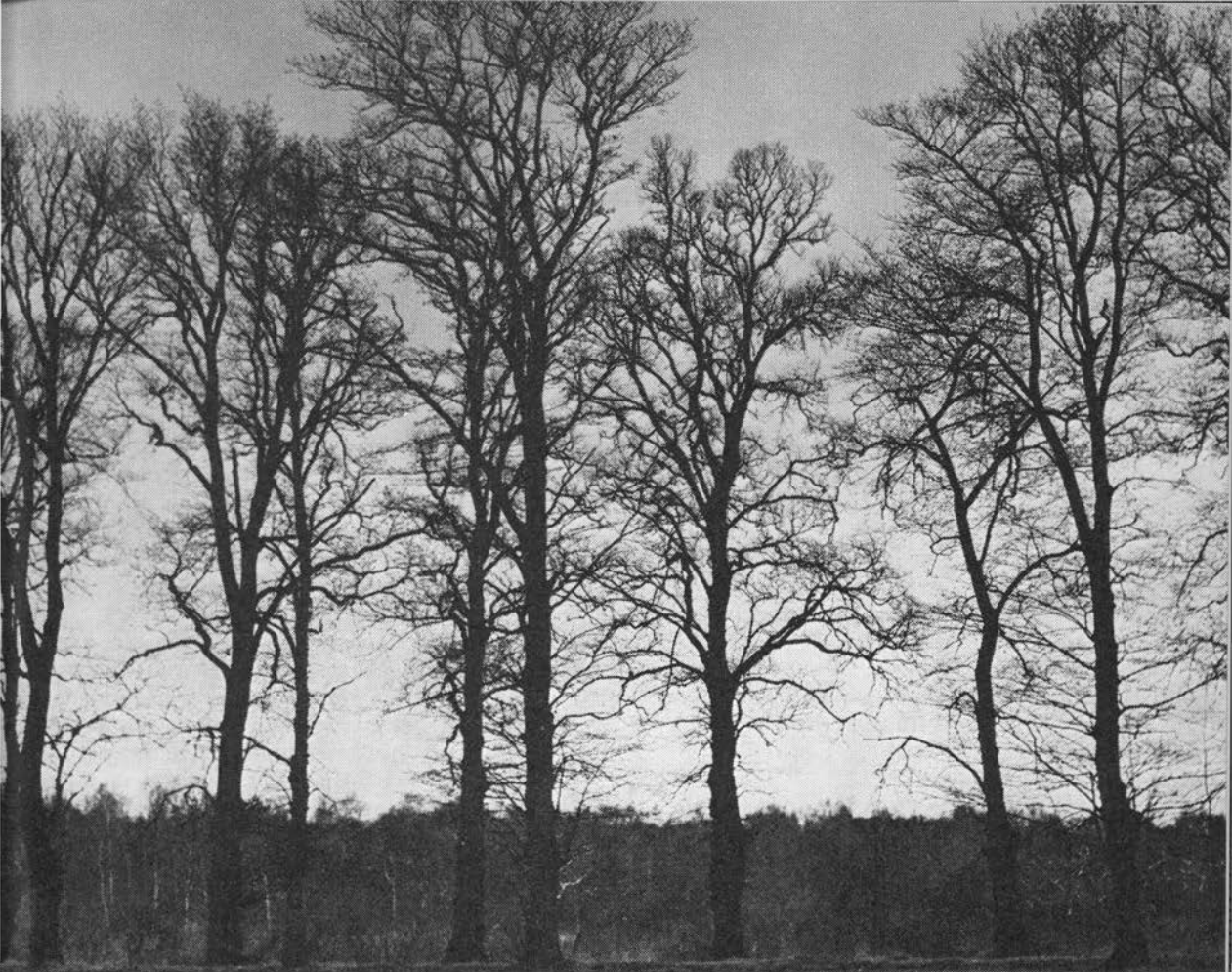
Allé af storbladet elm og skærmelm ved Boserup. (ES).

men et almindeligt park- og havetræ. »Hørsholmelm«, en smalbladet varietet fra Hørsholm planteskole 1880, findes adskillige steder ved og i København, hvor den som mere skyggegivende afløste de mange popler (s. 74), danner en allé ved Valnæsgård på Falster, langs vejen Viskinge-Kalundborg, Fuglebjerg-Bisserup o.a. steder, blev efter genforeningen plantet i Sønderjylland (6). Hovedstadsområdet har ca. 4.500 elme, som udgør størsteparten af dets træarter (6b).