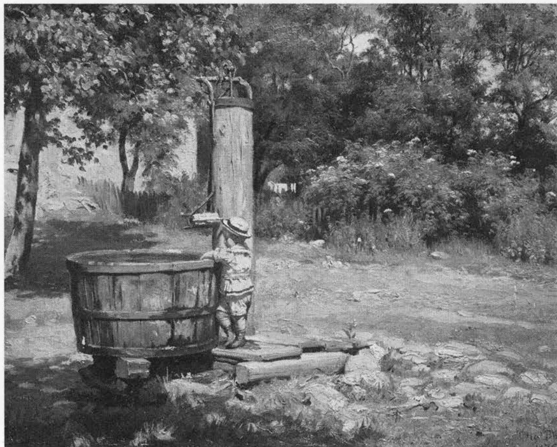
»Ved brønden«. Maleri af Otto Bache, 1876.

fra den svaje stængel. . . Syv søstre-enge. Så sødt forborgen . . . som dér de står i de lilla klæder Peter Vejrup (7). Engkarsens lille malteserkors . . . lod sig ydmygt trampe af får og hors . . . den var engens elskede Askepot. Olaf Gynt (8).