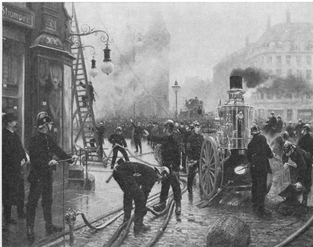
Brandslanger fremstilledes af hamp. Maleri af Paul Fischer: »Det brænder«, 1900.

af marken ruskes (8) ved fuldmåne, men ikke i den månedsdato den er sået (3).