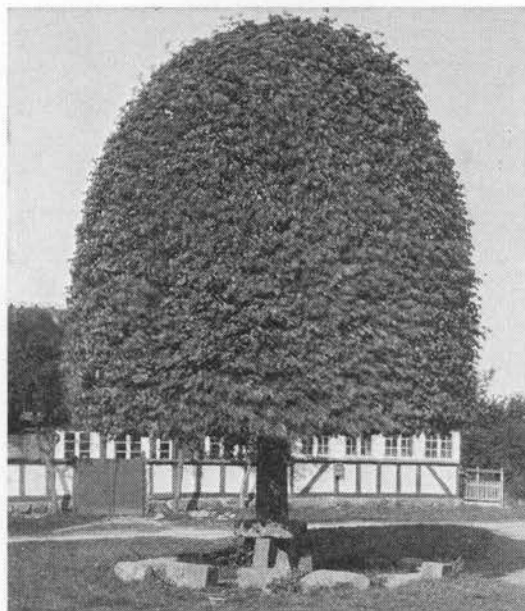
Bystævnelinden i Davinde.

527; (5) 622b 109; (6) 296 78,1962,363 sml. 64 16/11 1954; (7) 455 8/6 1952; (8) 161 1906/23: 860; (8b) 363 nr. 237,1901; (9) 885 31,1955,177; (10) 65 7/9 1948; (11) 953 16,58,62,92,102,113,214-16 m.fl.; (12) 930b 7.2,1963,781; (13) 551 7/5 1965; (14) 236 23/7 1958; (15) 452 1,278; (16) 194 3,1790,201; 939 1881 2,18; 950 188f; (17) 551 27/6 1953.