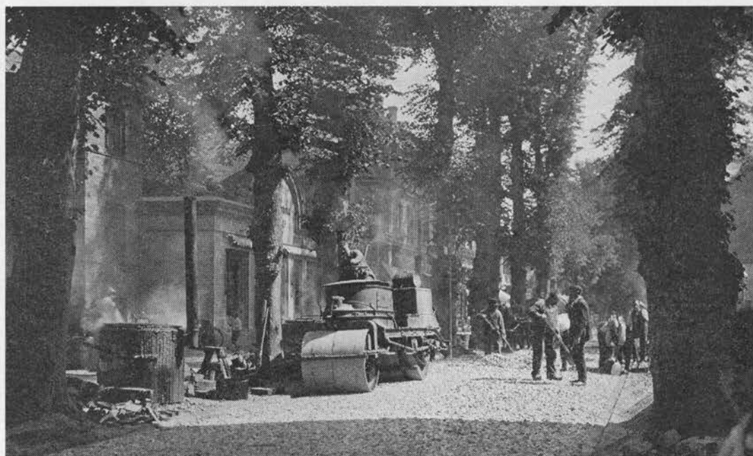
Jægersborg Allé i Charlottenlund stammer fra omkring 1710 og er her fotograferet ca. 1920. Overfor: Lindeallé i herregårdsparken ved Gammel Estrup, Djursland. (ES).

skifte 1901 blev i Hyllinge ved Næstved plantet en lind som »Frihedstræ« (86).