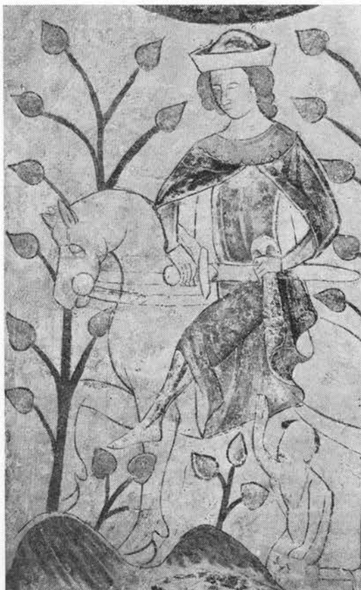
Den hellige Martin blandt lindetræer på et middelalderligt kalkmaleri i Faneffjord kirke, Præstø amt.

Der stod altid vand i en hul lind i Kjeldsgård have, Salling, her vaskede genfærdet af en jomfru og barnemorderiske sine hænder (11). I hoveritiden skal bønder før de kom på træhesten være blevet bundet til en stor enlig lind ved Gl. Frederiksdal (2). En vældig lind ved Süderheistede i Ditmarsken visnede efter landets erobring, men engang skal en skade i kronen ud-