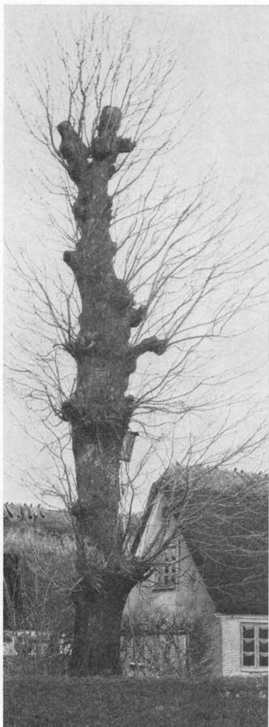
Brandtræ i Padholm, Sønderjylland. Under første verdenskrig gemte aftægtsfolkene deres korn i træets hule stamme.

ter i omkreds, 7–8 mand kunne stå oprejst i hulrummet, alderen ansloges til ca. 400 år. Træet blev flere gange solgt ved auktion, men ingen turde fælde det, eller det blev måske købt tilbage af gårdens ejer. Faldt for orkanen 17/10 1967 (4).