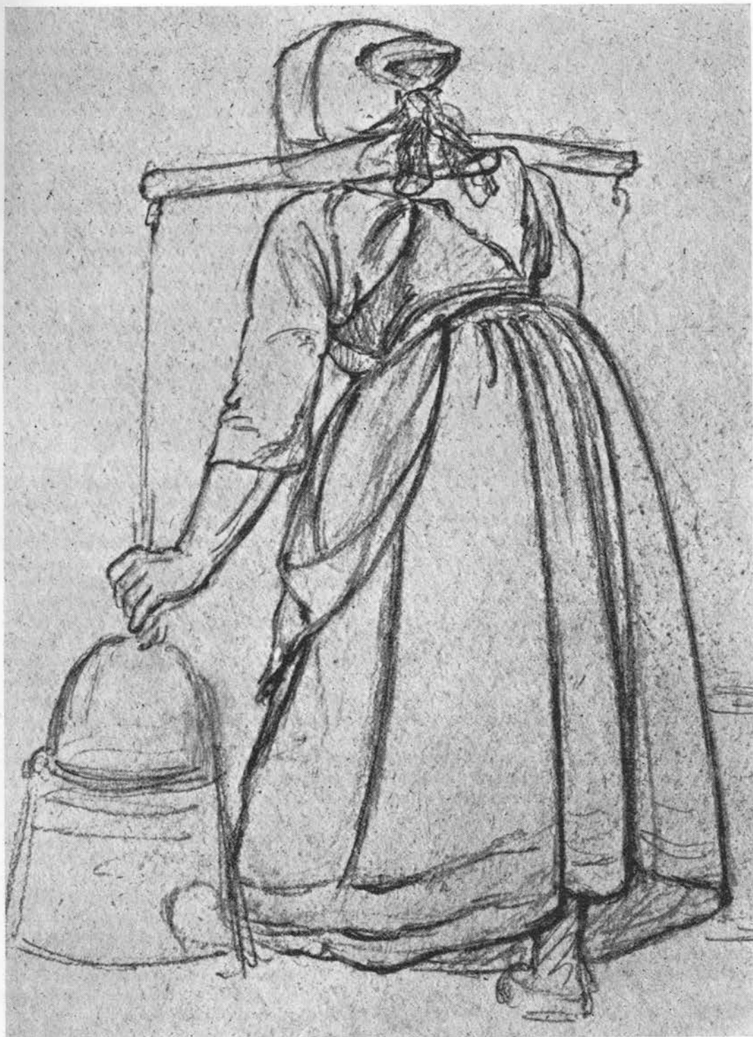
På grund af ahorntræets hvidhed anvendtes det gerne til mælkespande og -bøtter. Tegning af A. J. Larsen, 1851. Kobberstiksamlingen.