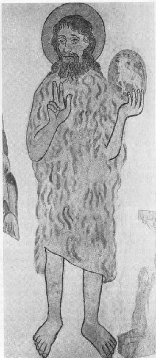
Johannes Døberen. Kalkmaleri i Søborg kirke, Frederiksborg amt.

PRIKBLADET PERIKON, Hypericum perforatum , har oprette 30–50 cm høje stængler og i juli-august en top af gule blomster med talrige støvdragere i tre knipper; på randen af de allerøverste blade samt bægerbladene sidder sorte kirtler,