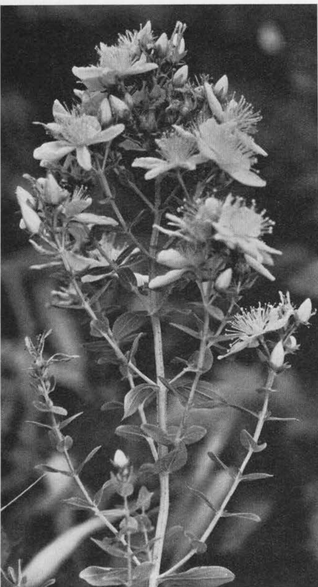
Prikbladet perikon, også kaldet Sankt Johannesurt. (N).