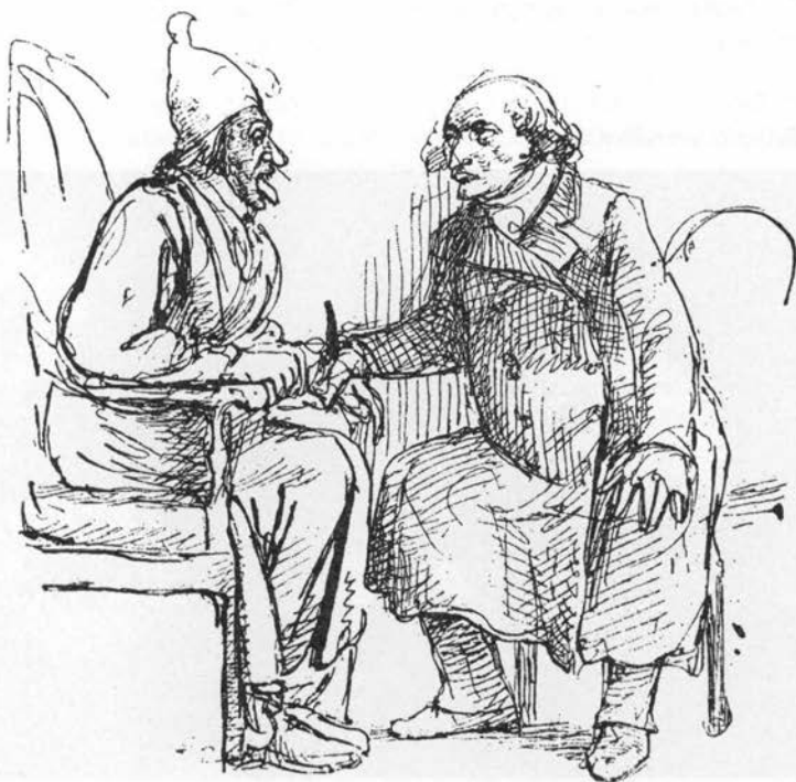
Læge tilser febersyg patient. Tegning af Wilhelm Marstrand.

Flere arters tørrede og pulveriserede bark er anvendt mod feber, koldfeber (malaria) i stedet for kinabark (5), en stærk te af inderbarken er god mod feber, brystsyge og kuldegysninger (Thy o.