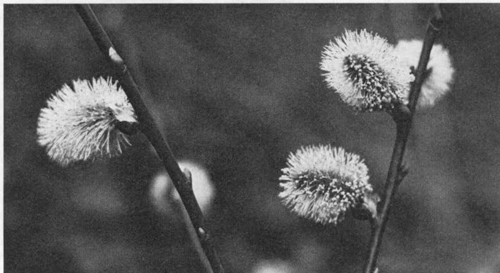
Seljepil, hanrakler. (PAA).

Nogle folkelige navne (s. 49) skyldes, at de raklebærende kviste i den katolske tid blev benyttet som »palmegrene« på palmesøndag, i