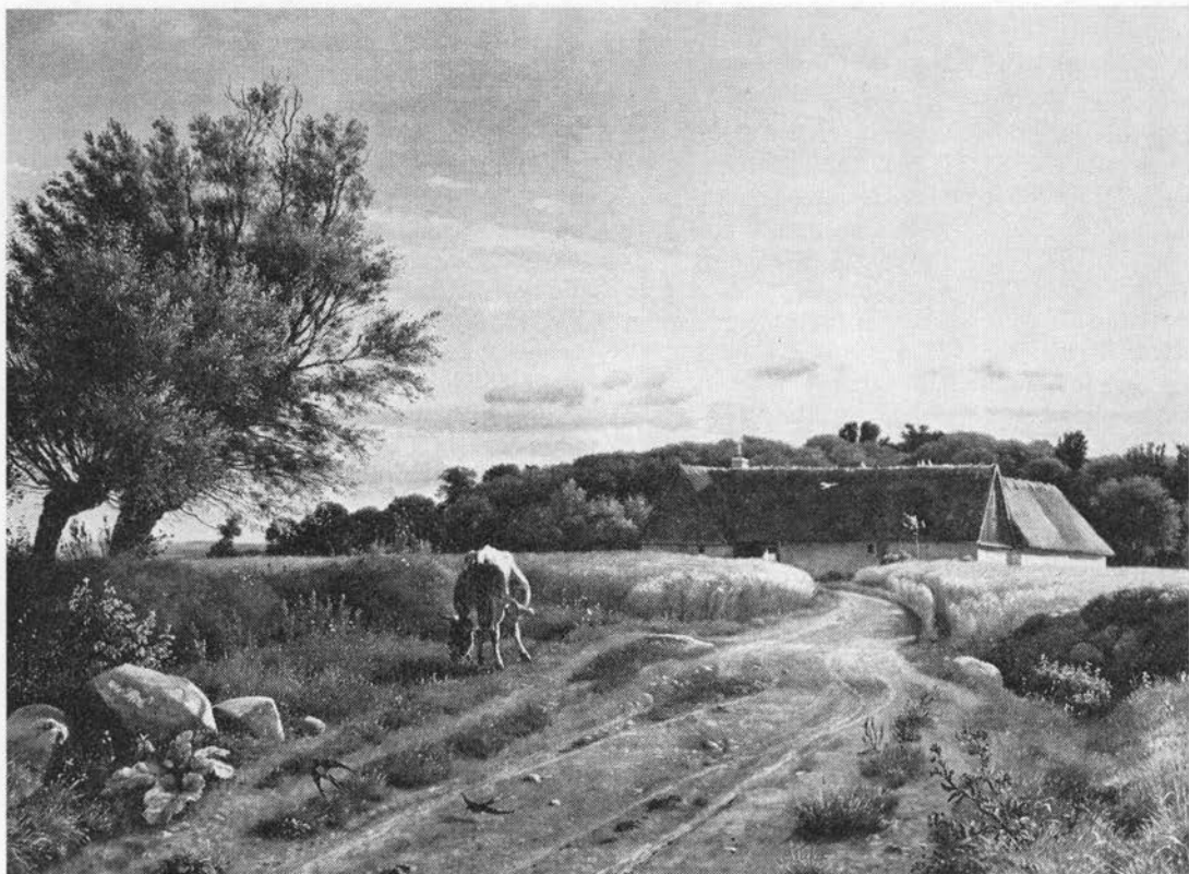
Stynede hvidpile. Maleri af J. Th. Lundbye: »Et Boelsted«, 1847. Statens Museum for Kunst.

samles om sommeren pilekviste til ildebrændsel (30). – Man tænder lyng og vidjer, når en ræv skal ryges ud (VJylland; 55). Trøsket pileved anvendes i fyrstøj (56), hyrdebørn bruger det, når de tænder ild (ØJylland; 57). I fyrstønden (glødfadet) ligger ofte piletrøske (NFyn; 32). – Trækul af forskellige pilearter er gode til krudt (58), som da giver højt knald (59); de anses for bedst til pasteltegning (60).