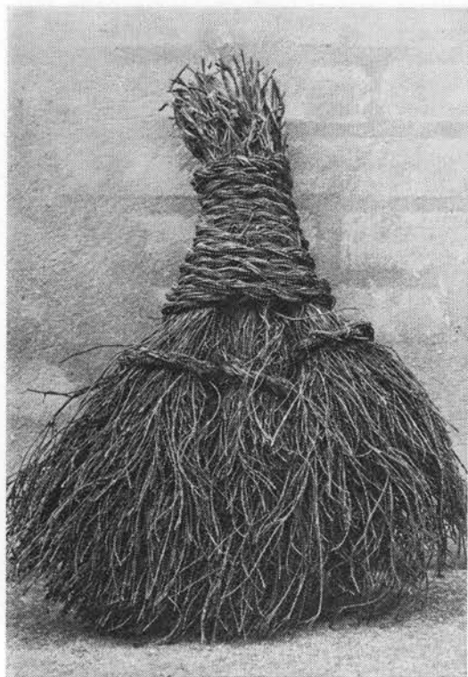
Kost af revlingsris.

sogne; de solgtes af fremstillerne, der gik fra gård til gård, eller af pottemænd i Sønderjylland og på Fyn indtil o. 1900 (7).